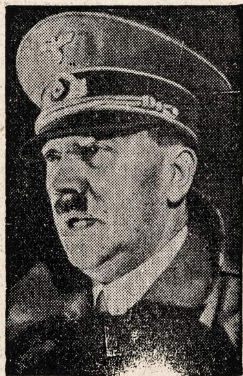
Kairėj gen. Eisenhower, kuris vadovauja sąjungininkų armijai Viduržemių juroje. Vidury marš. Badoglio, kuris Italijos vardu paskelbė karą Vokietijai. Dešinė A. Hitleris, vokiečių karo jėgų vyriausiasis viršininkas.

bombų, kiek naciai išmetė sunkiausio Londono bombardavimo metu.