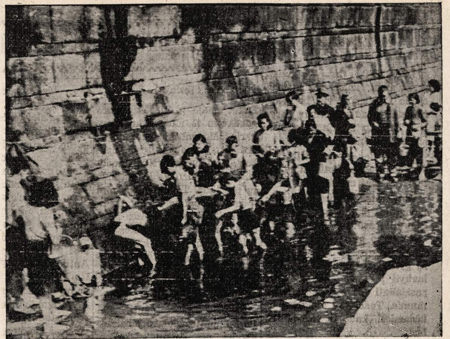
Kai sąjungininkų kariuomenė įžengė į Napoli, tai ten vandens trukumas buvo nepaprastai didelis. Mat, pasitraukdami iš miesto, vokiečiai sunaikino vandentiekį.