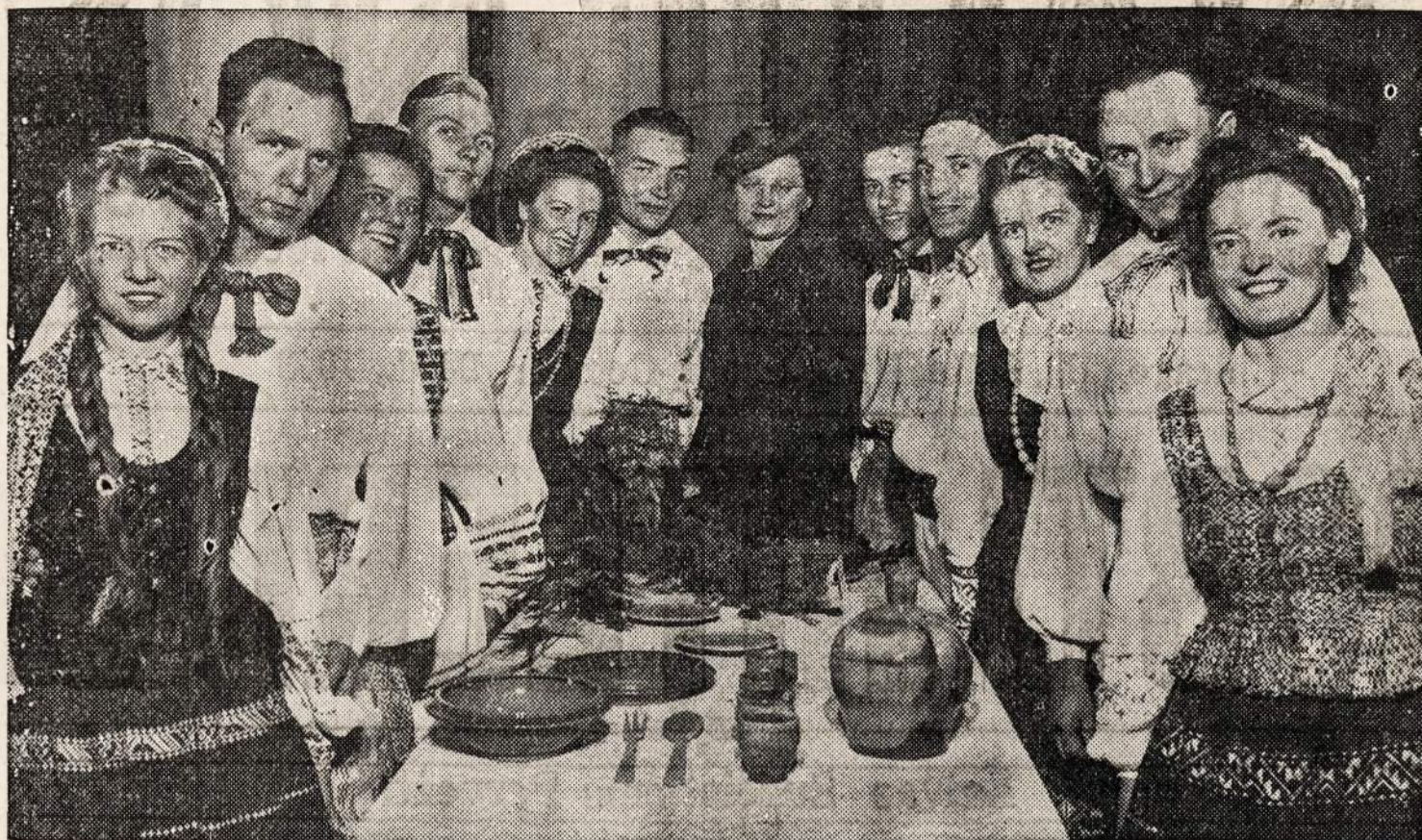
Ateitininkų draugovės šokėjų grupė, kuri spalio 24 d. pildo kareiviams programą Highland Park, Ill.

REMKITE TUOS, KURIE GARSINASI "NAUJIENOSE"