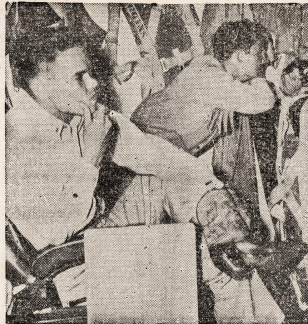
Kaubojai klausosi savo vado instrukcijų, kurios buvo susijusios su Wake salos bombardavimu spalį 5-6 d. Tie kaubojai yra vieno lėktuvnešio įgulos nariai.

REMKITE TUOS KURIE GARSINASI "NAUJIENOSE"