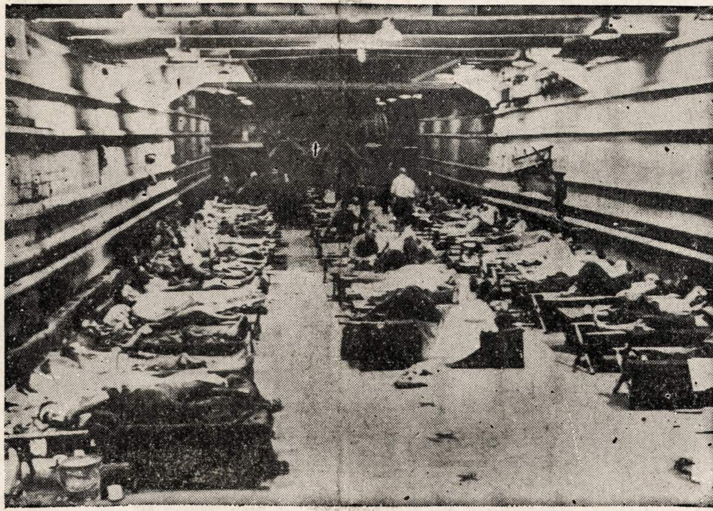
LST laivas (tokie laivai yra naudojami tankams ir kariuomenei gabenti) tarnauja ir kaip transportas sužeistiems kariams gabenti į militarines ligonines Pietiniame Pacifike.

ious" dalyvavo Koralų jūros kovose, padėjo vykdyti karo veiksmus pietų Pacifike. Pirmą kartą paskelbta apie britų karo laivų intervenciją Pacifike.