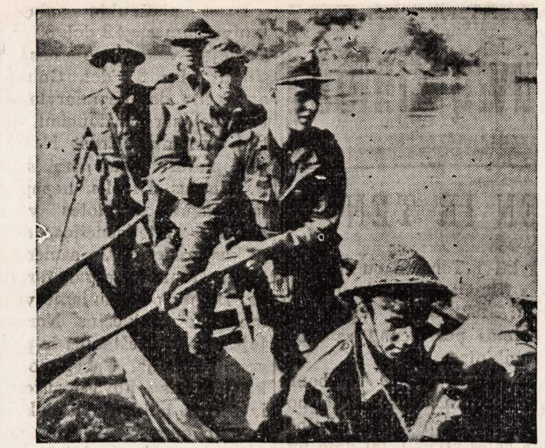
Nacių belaisviai, kurie buvo pagauti, kai jie bandė persikelti per Voltorno upę ir pabėgti į Italiją. Britai juos vėl grąžina į belaisvių stovyklą