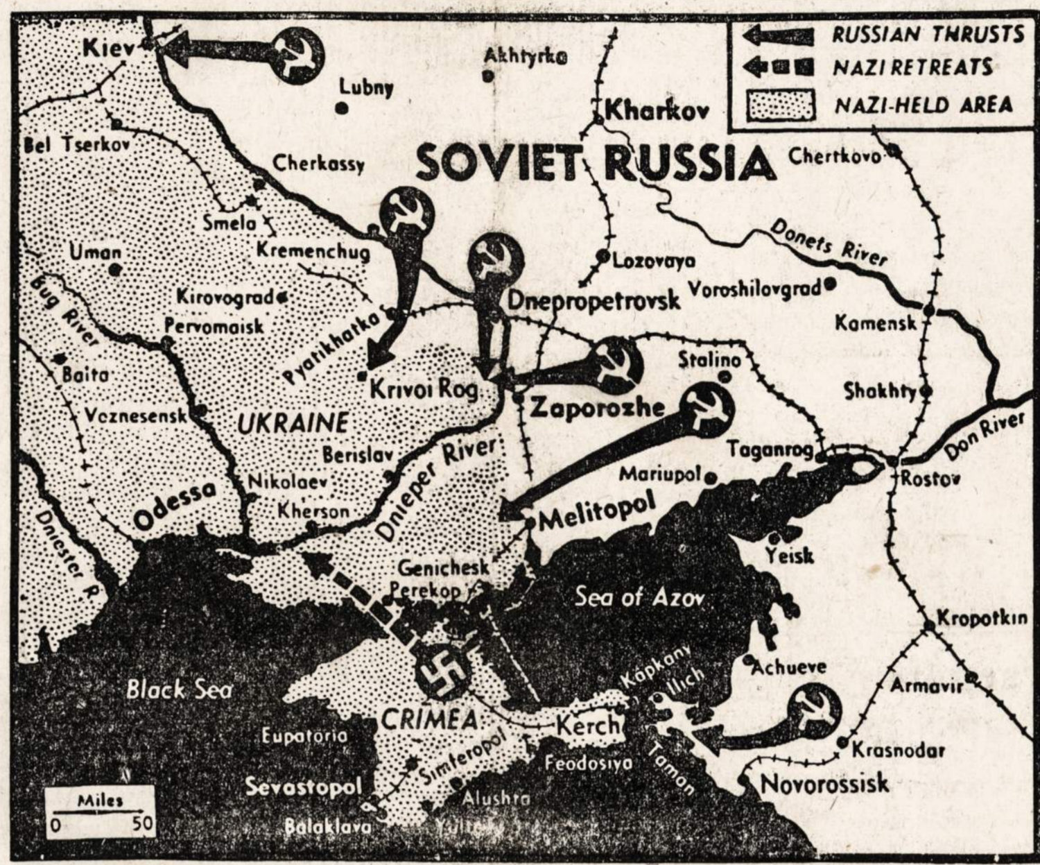
Zemėlapis parodo kryptį, kuriomis keturios rusų armijos vysto ofensyvą. Tų armijų tikslas—atkirsti Kryme esančius vokiečius.