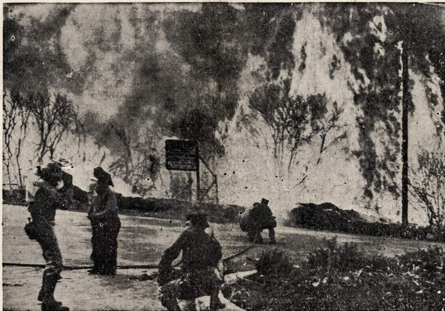
Apie 1,000 kareivių prisidėjo prie miško darbininkų, kad bendromis jėgomis galėtų sulaukyti gaisrą, kuris Malibu Lake (Calif.) srityje sunaikino 10,000 akrų miško. Sudėgė nemažas skaičius ir namų.