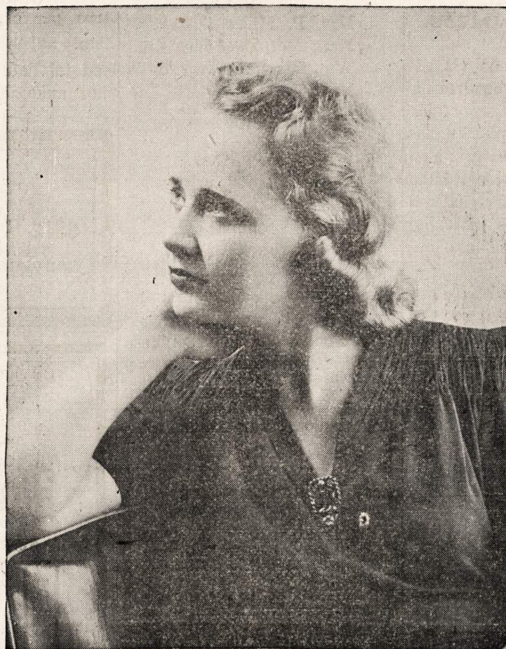
ONA SKEVERIUTE ("ONUKS")—Soprano