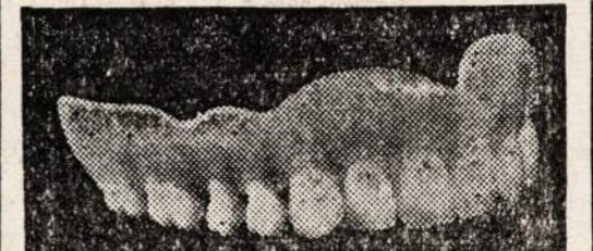
VARTOJAMAS NAUJAS PLASTIC MA TERIJAS. NATURALIS GUM SPALVOS DANTŲ PLETOMS

NALIOS RUSIJS VELVATONE DANTŲ PLETŲ $12.50 iki $39.50 už kiekvieną.