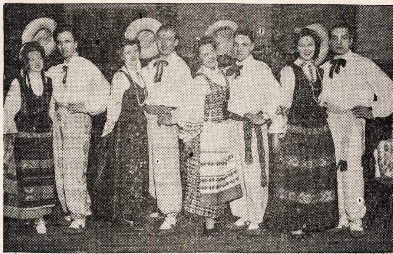
ATEITININKŲ DRAUGO VĖS ŠOKĖJŲ GRUPE

PRADŽIA 3:30 POPIET IŽANGA ASMENIUI 99c — SU TAKSAIS