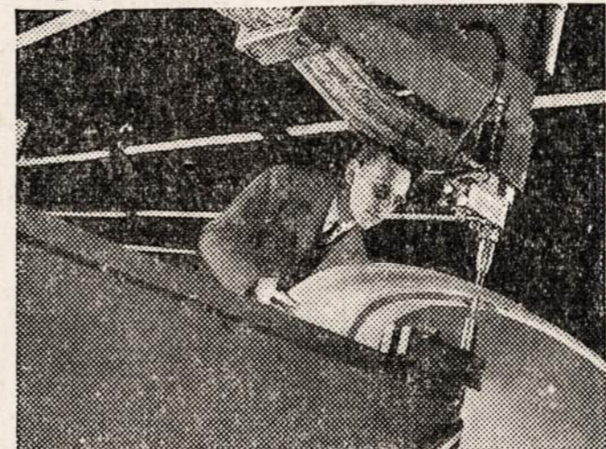
Štai nauja elektrikinė mašina vartojama velidiniui aluminium dalių Laivyno P-T laivam