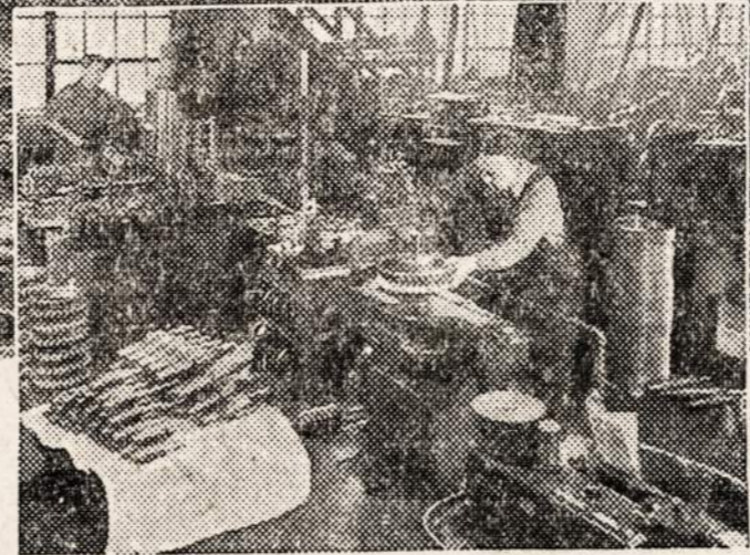
Chicagos srity, karo dirbtuvėj. Elektrikinė Jėga gelbsti gaminti P-T laivų motorų gyrus.