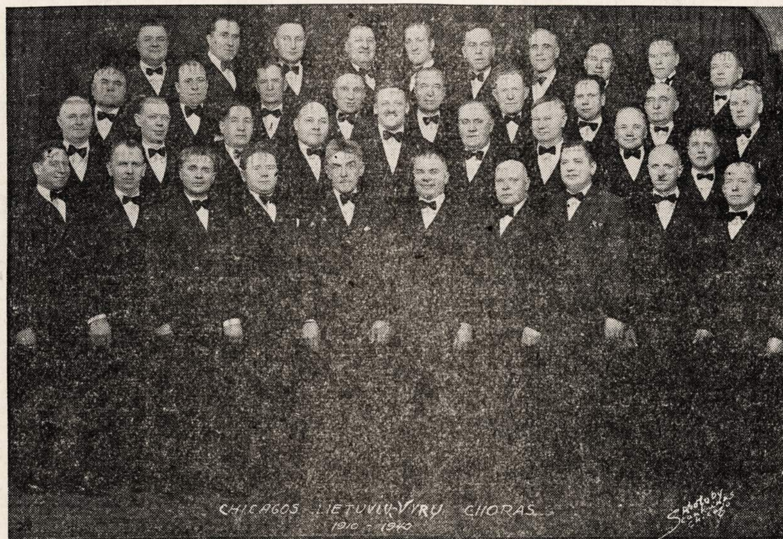
CHICAGOS LIETUVIŲ VYRŲ CHORAS