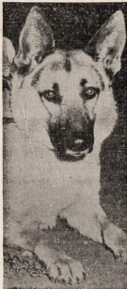
"Argo" kalbant šuo, kuris gal bus panaudotas kaip liudininkas sutartis su lauzūmo byloje Minneapolisje, Minn.