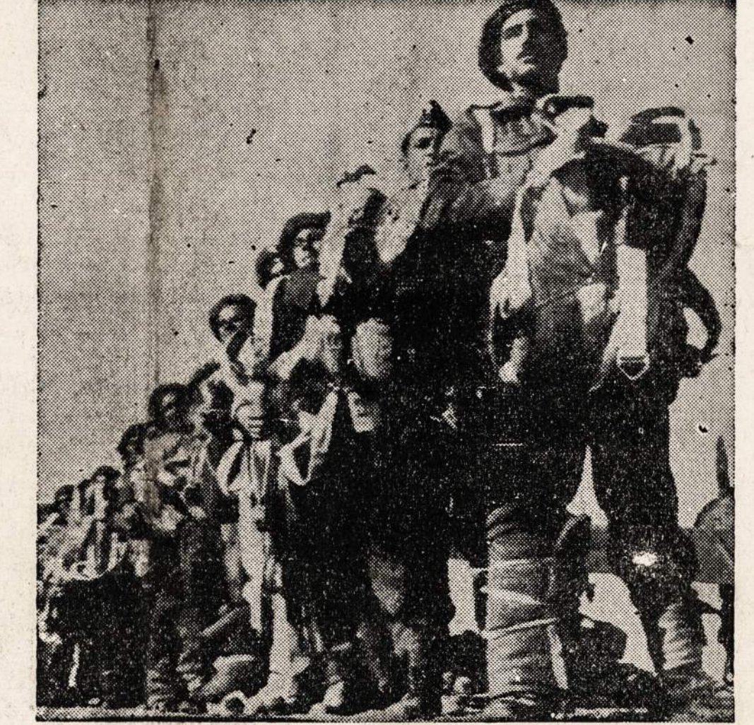
Graikų parašutinininkai iš išgarsėjusios "Padaryk arba mirk" brigados Samos saloje, kuri randasi tik 40 mylių nuo Leros. Paskutinėmis žiniomis, vokiečiai Leros salą atsiėmė iš anglių.