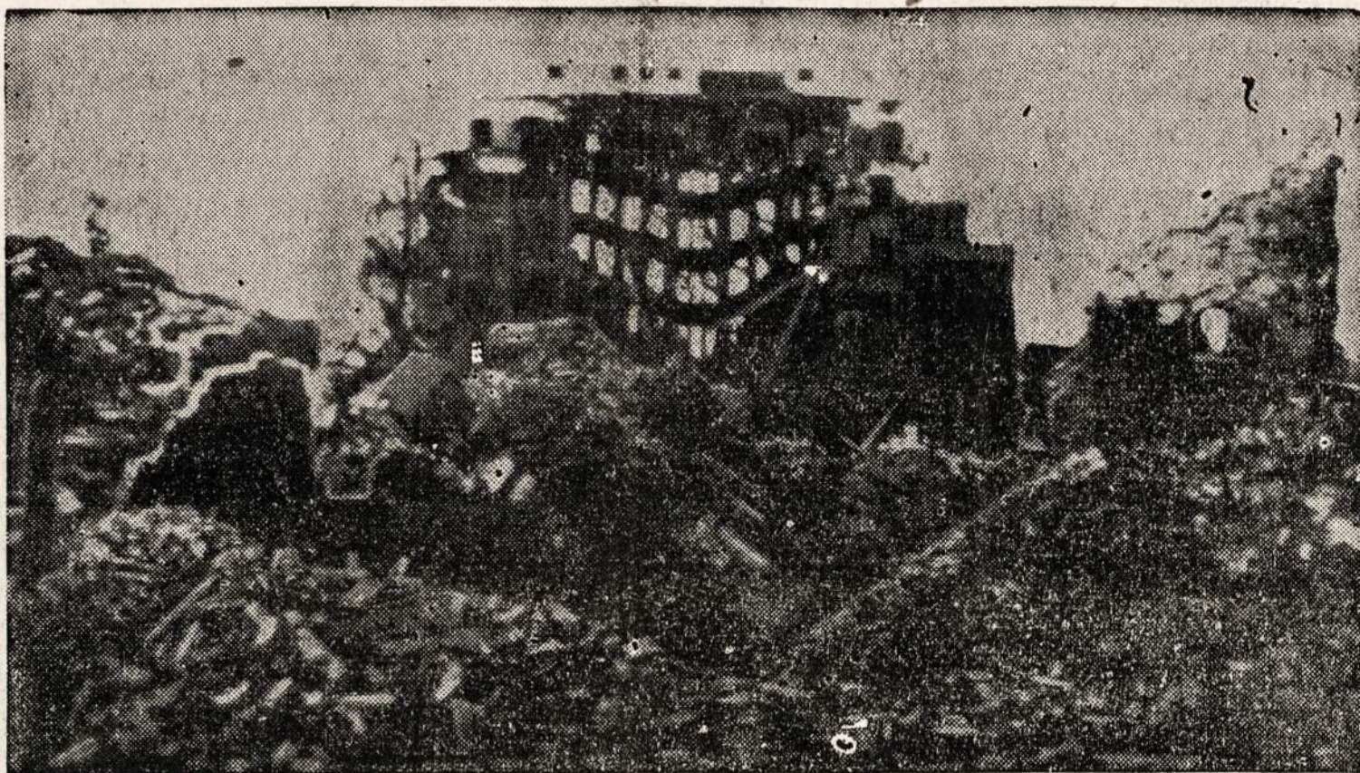
Iš Hamburgo behasiliko tik griaučiai. Nuo pakartotino bombardavimo tas vokiečių miestas labai skaudžiai nukentėjo, — namai liko išgriauti ir tukstančiai žmonių priversti buvo kraustyti kitur gyventi.