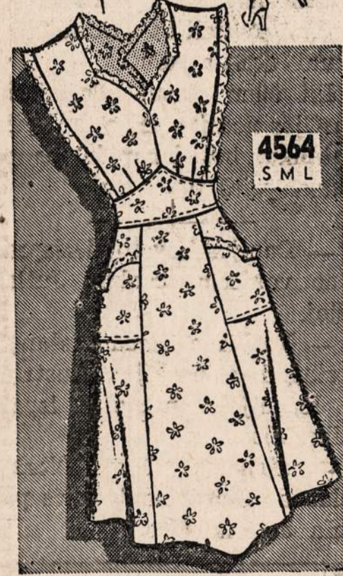
4564—Gražios priejuostės — Mieros 32, 34, 36, 38, 40, 42.

Norint vieną ar daugiau pavyzdžių iškirpti pavyzdį ir numerį, pažymėkit mērą ir aiškiai parašykite savo vardą, pavardę ir adresą. Siuokit pinigų arba pašto ženkliais kartu su užsakymu. Adresuokit—NAUJIENOS PATTERN DEPT., 1739 So. Halsted St., Chicago, Ill.