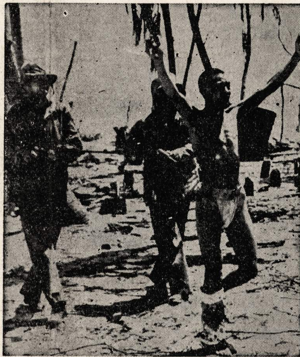
Šis labai menkai apsirengęs japonas išliko gyvas Tarawa saloje ir liko paimtas į nelaisvę. Bandažas ant kojos rodo, kad jis buvo sužeistas.