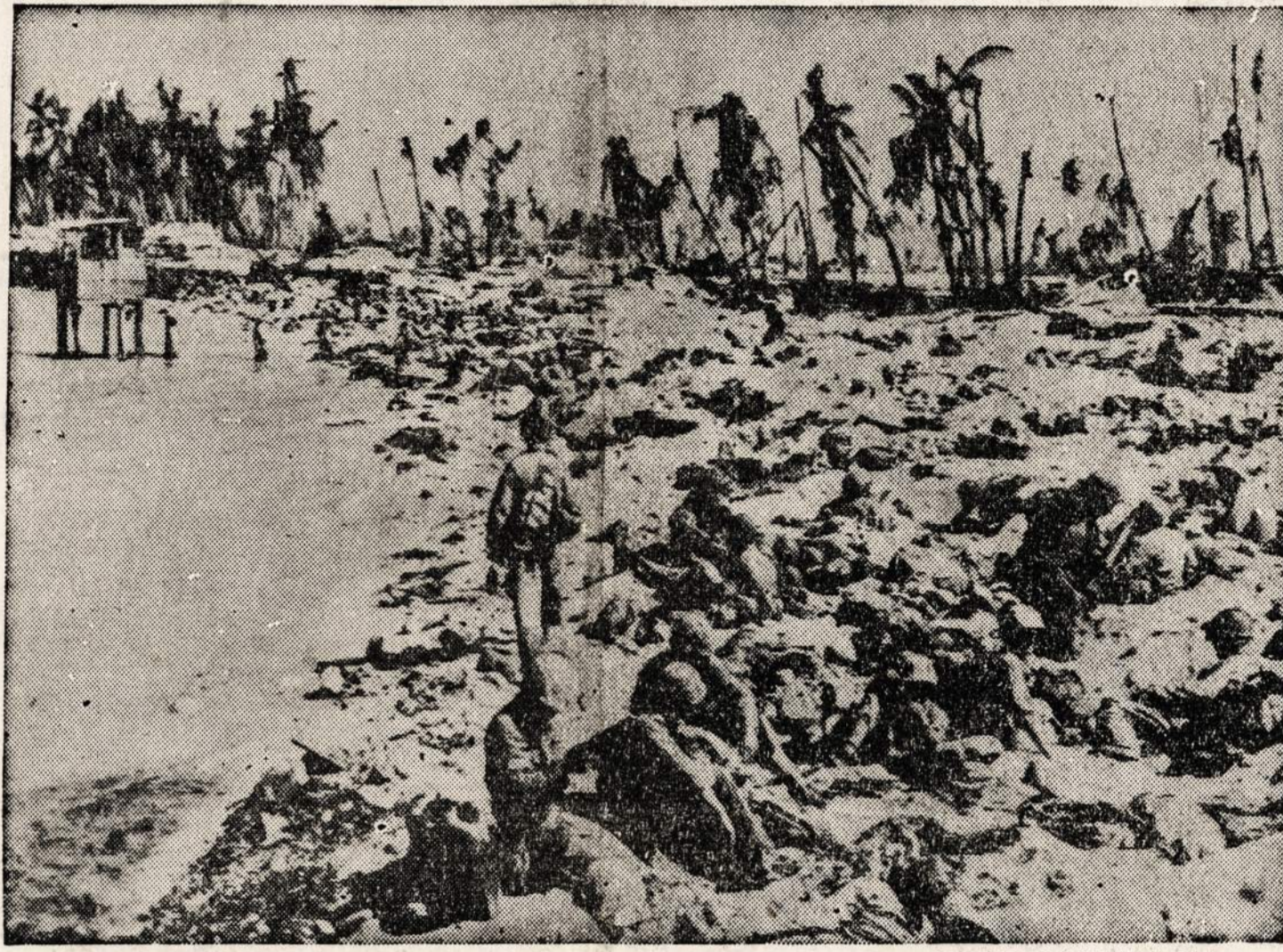
Amerikos marinai, kurie išliko gyvi po baisaus mušio Tarawa saloje, ilsisi aplūdimyje. Aukščiausia saloje vieta yra tik šešios pėdos aukščiau jūros lygio.