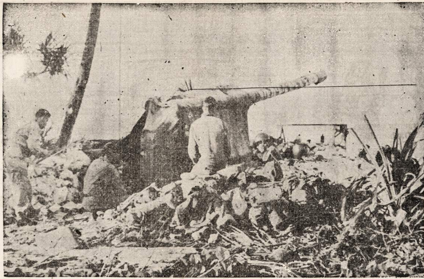
Makin saloje japonai buvo įsitaisę kanuolių iškamšas, kad amerikiečiai manytų, jog ta sala yra stipriai apginkluota. Amerikos kariai apžiūri "kanuoles."

gų apsaugojimo, pirmosios pagalbos ir panašūs kursai buvo suorganizuoti. Mokytojai, ekspertai savo srityse, veda tuos kursus. Užbaigus, teorija papildoma praktikos darbais.