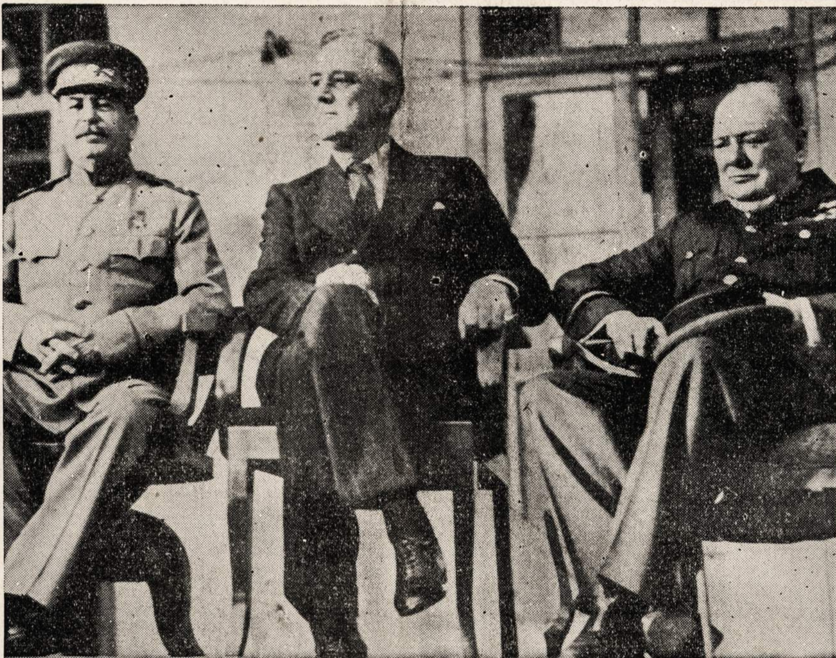
Premjeras Stalinas, Prezidentas Rooseveltas ir premjeras Churchill, sąjungininkų vadai, kurie atlaikė konferenciją Teherane, Irano sostinėje.