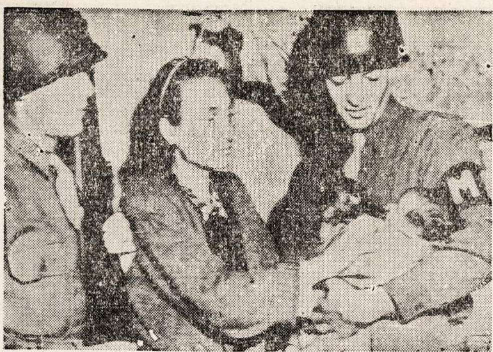
Militarinės policijos nariai, kurie rūpinosi šiuo kurdikiu, kuris gimė Napol o slėptuvėje laike oro atakos.