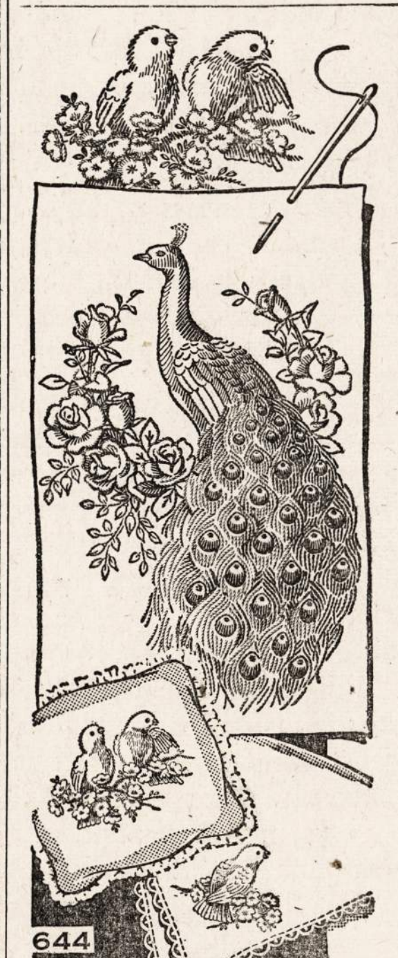
644—Išsiuvinėjimai padūškom ar baltiniams.

NAUJIENOS NEEDLECRAFT DEPARTMENT 1739 S. Halsted St., Chicago, Ill. No. 644