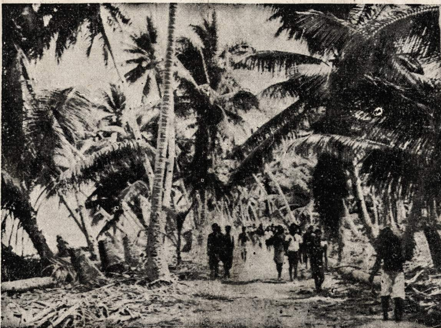
Tarawa salos gyventojai grįžta į savo namus po to, kai Amerikos marinai laimi vieną iš kruviniausių mušių ir sunaikina japonų garnizoną.