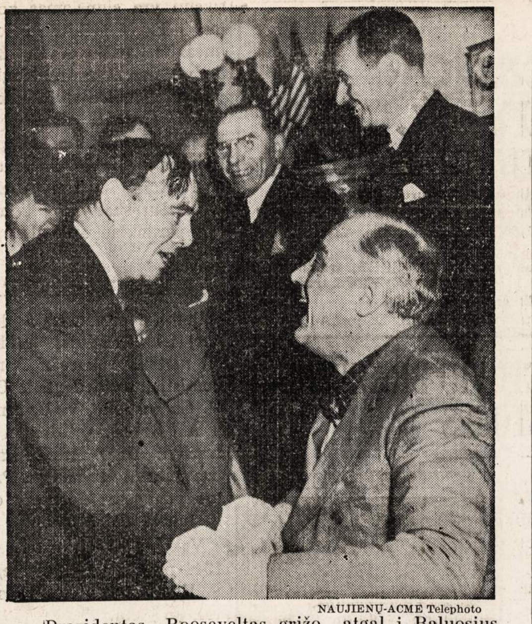
Prezidentas Rooseveltas grįžo atgal į Baltuosius Rumus, kur atvyko jį pasitikti Joseph Martin, republikonų vadas Atstovų Bute. Viduryje yra kongresmanas Sol Bloom.