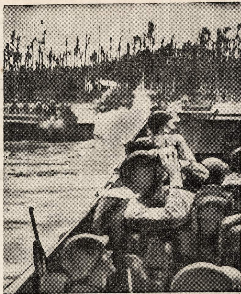
Amerikos kareiviai pasirengę atakuoti Arawe Naujojoje Britain saloje. Kareiai baimingai žiuri į padangę, iš kur laukia priešų lėktuvų. Ir iš tiesų priešų lėktuvai netrukus pasirodė ir puolė amerikiečius.