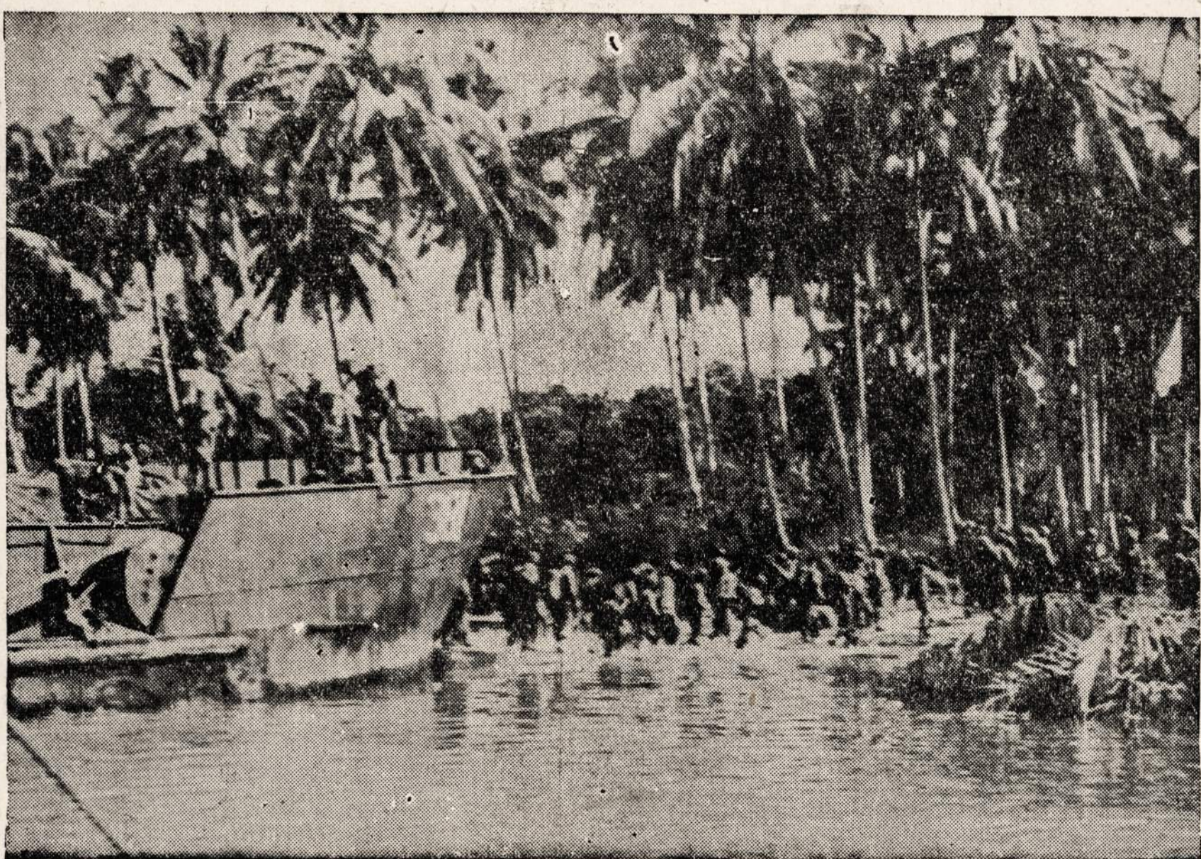
Amerikos kariuomenė apleidžia baržas ir ir lipa į krantą Arawe srityje, New Britain saloje. Šis paveikslas buvo nuimtas gruodžio 15 dieną.