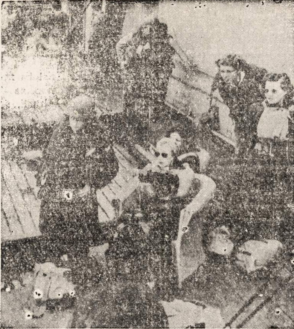
Naujienu ACME Telephone. Nacių submarinas atakuoja transportinį laivą, kurio buvo gabenama Amerikos kariuomenės ir Raudonojo Kryžiaus merginos. Tačiau submarinas buvo nuvytas. Šį paveikslą nutarė Charles Zaimas, Raudonojo Kryžiaus korespondentas.