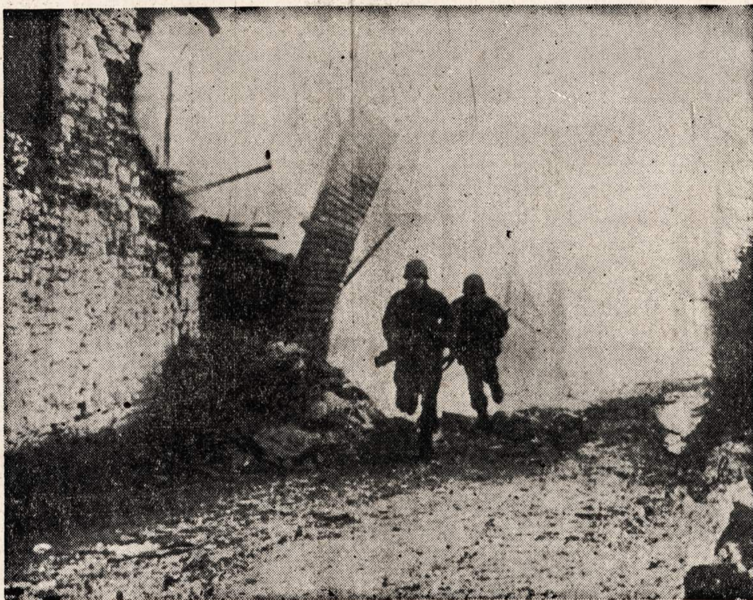
Amerikiečiai, nežiūrint nacių pasipriešinimo, žygioja pirmyn, — jie užima Mont-Le Ban miestuką Belgijoje.

bet karininkai nelieps jiems mesti ginklų, sako belaisviai. Iš Vokietijos ateiną pranešimai sako, kad šiaurėje nacių valdžios bašina jau pradėjo irti, gyventojai jų neklauso.