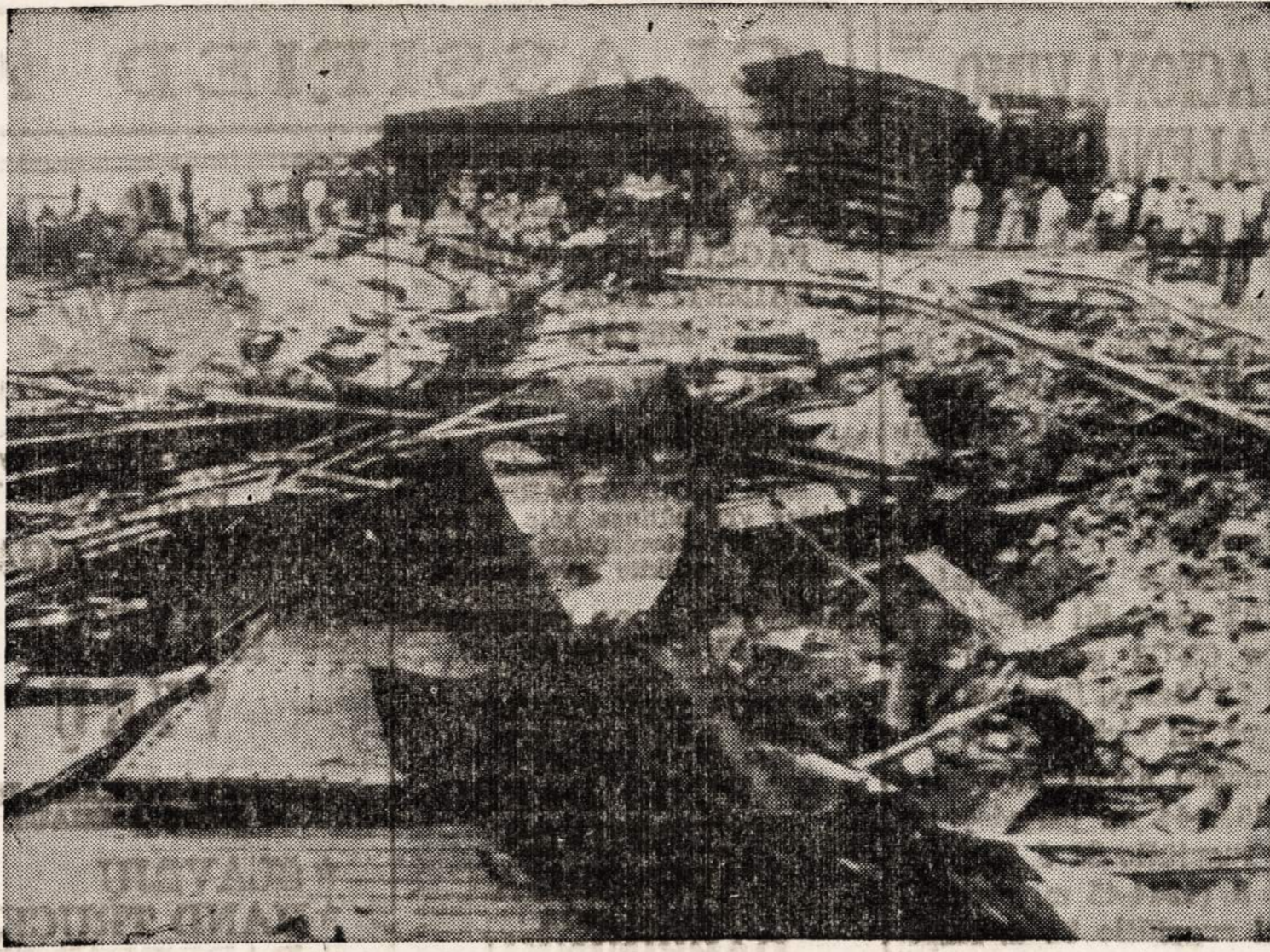
Vaizdas didžiausios geležkelio nelaimės Meksikoje. Nelaimė įvyko apie 100 mylių nuo Meksikos Miesto. Nelaimėje žuvo 96 žmonės. Sužeistų skaičius siekia 63. Nukentėjo pilgrimai, kurie važiuo į San Juan De Los Lagos šventovę.