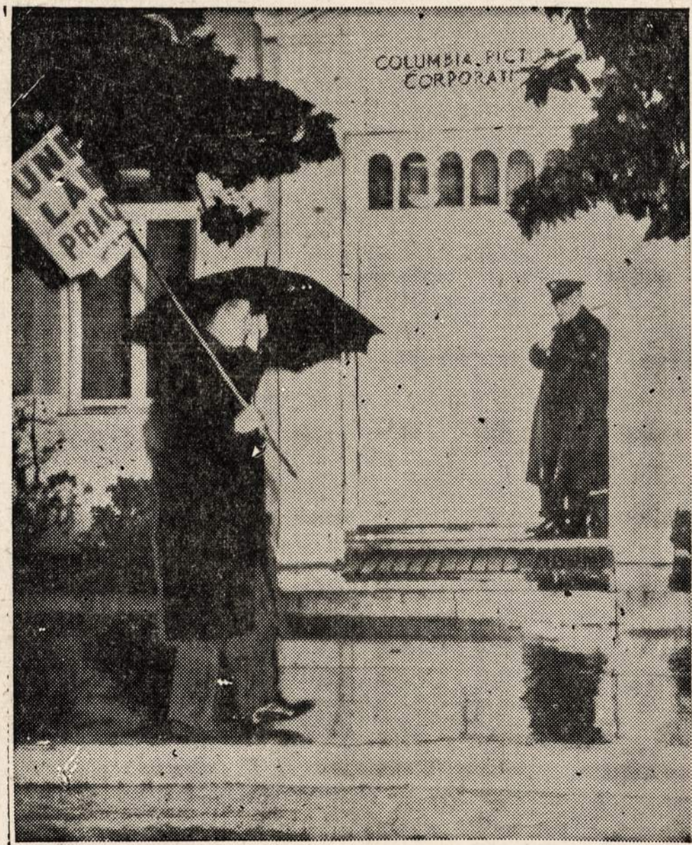
Pikietuojamas Hollywoodo kino studijos. Sustreikavo 3,000 vadinamųjų "ekstra" aktorijų.