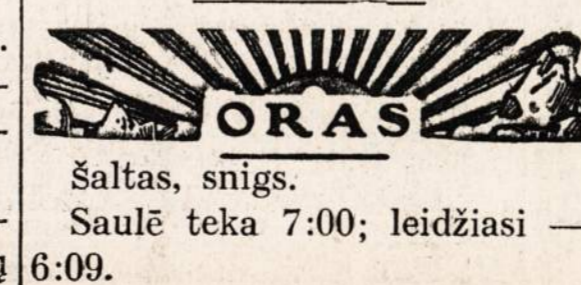
Šaltas, snigs. Saulė teka 7:00; leidžiasi — 6:09.

Vokiečių štabas paskelbė, kad jų garnizonas Budapešte dar kovoja prieš puoliančius rusus.