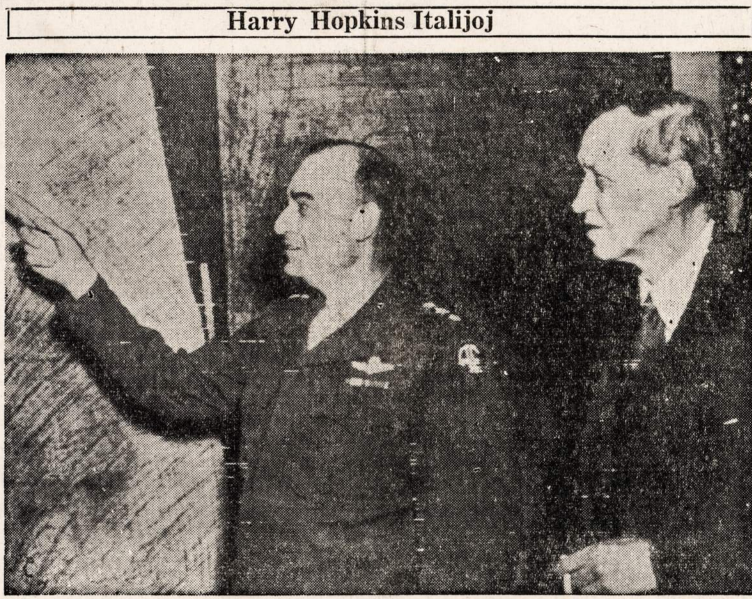
Lt. Gen. Joseph T. McNarney kalbasi su Harry L. Hopkins, kai pastrasis atvyko į Italiją.

Japonų karo vadovybė paliko labai mažus kariuomenės dalinius pietiniam Luzon pu-