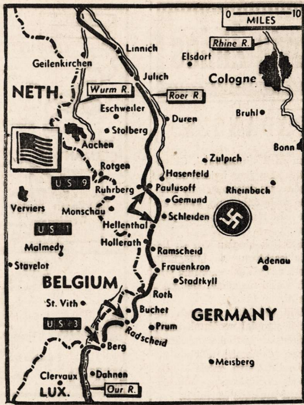
Amerikos 3-čios armijos daliniai įsibrovė į Siegfried linijos portus netoli nuo Prum ir užėmė Radschid

Į klausimą, ar darbininkas gali mesti darbą, jeigu jisai yra nepatenkintas sąlygomis arba to darbo nemėgsta, Kuz-