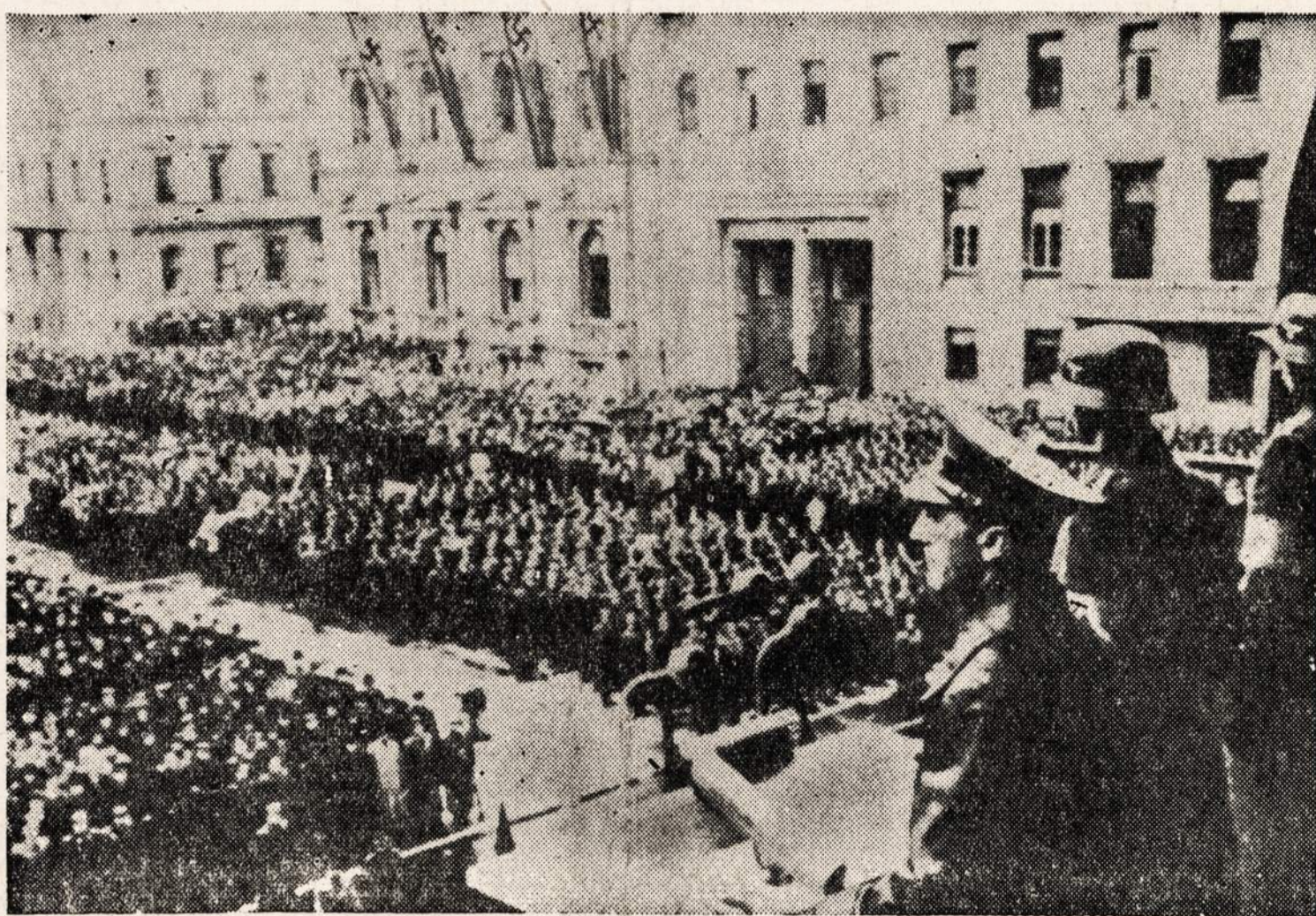
Dr. Joseph Goebels, nacių propagandos ministeris, kalba į Berlyno "namų gvardiją" iš ministerijos balkono.