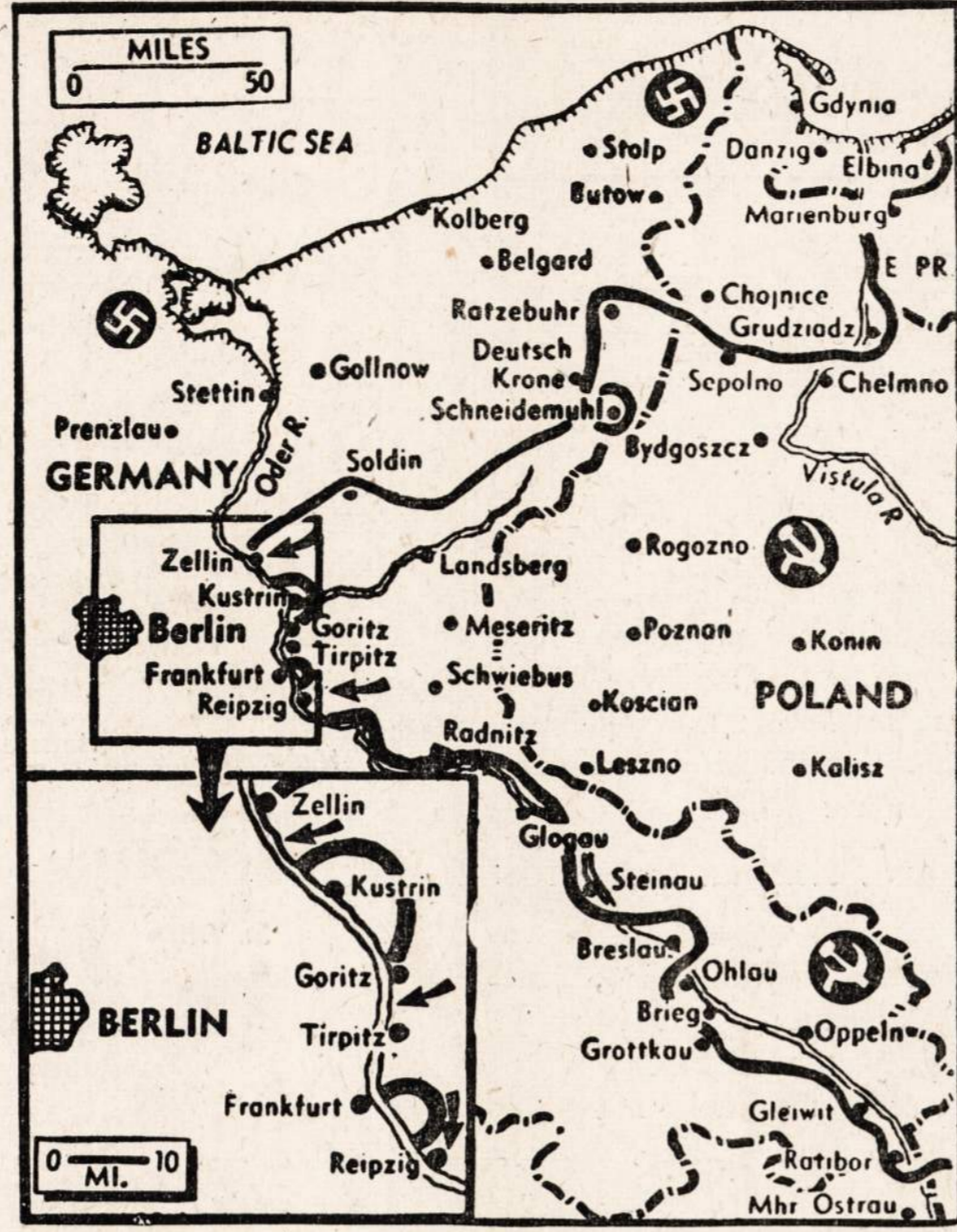
Naciai prisipažįsta, kad rusai trijose vietose persikėlė per Oder upę.

su skyriaus tikslais ir darbuote nutarta vasario 24 d. turėti šokių su lengvais užkandžiais ir kava, tai paruošti pavesta skyriaus moterims.