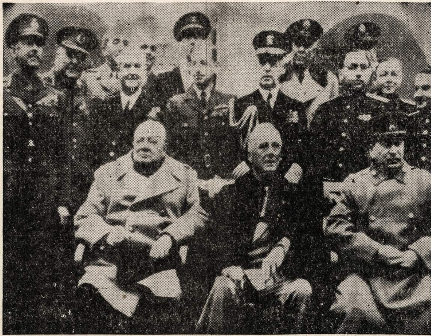
Prie Jaltos palociaus Kryme premjeras Winston Churchill, Franklin D. Roosevelt ir maršalas Stalinas su feldmaršalu Alexander, feldmaršalu Wilson, feldmaršalu Sir Alan Brooke, laivyno admiralu William D. Leahy, laivyno admiralu Ernest J. King, armijos generolu Geo. C. Marshall, generolu Sir Hastings Ismay ir laivyno admiralu Sir Andrew Cunningham; kiti yra rusų karininkai.