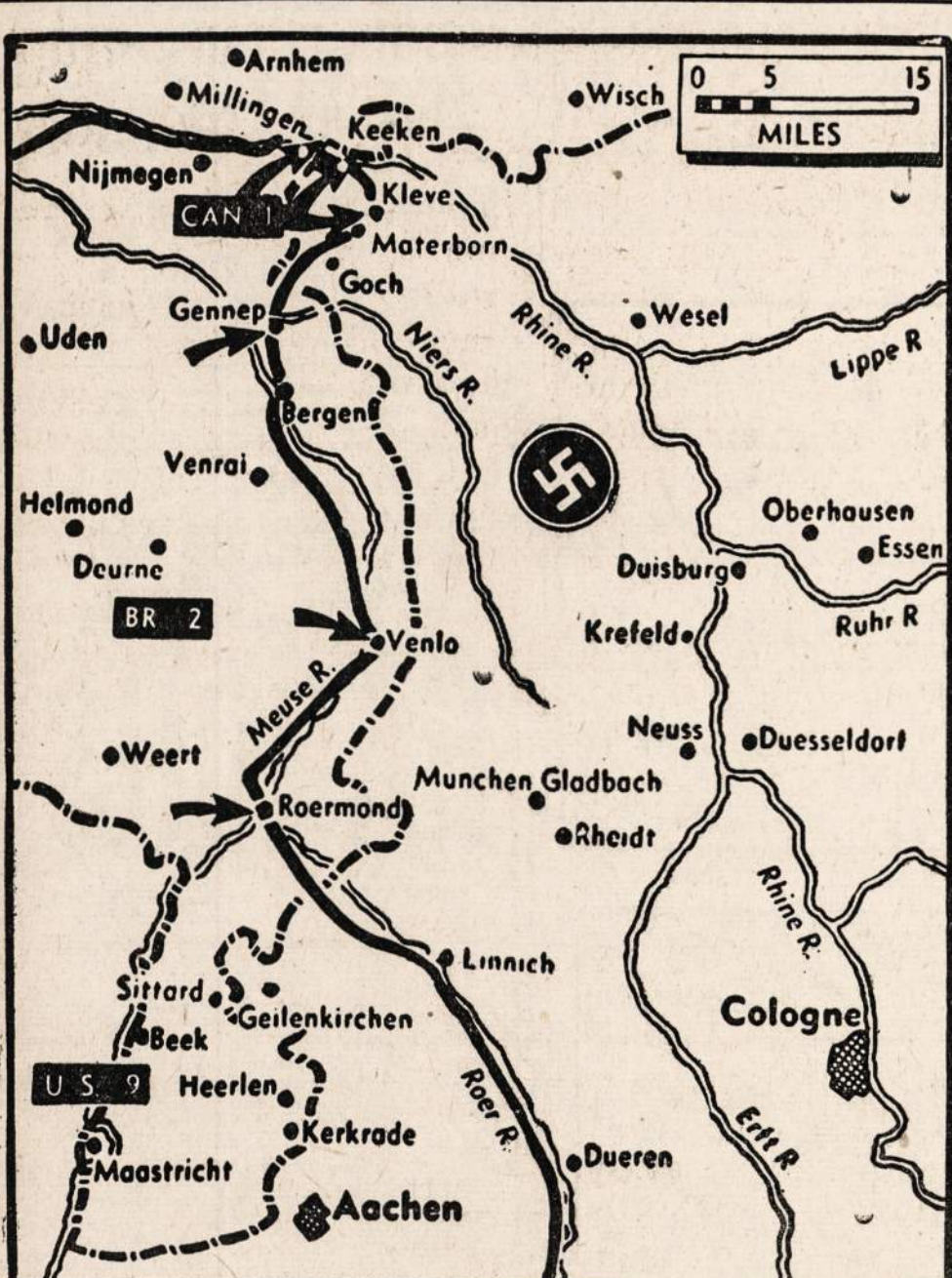
Kanadiečiai ir anglai prasimušė per mišką prie Kleve ir užėmė tą tvirtovę.

Viesulai praužė praėjusį antradienį, vasario 13 dieną. Mississippi ir Alabama valstijose. 42 žmonės žuvo dėl jų, o apie 200 buvo sužeistų. Turtui padaryta keletas šimtų tūkstančių dolerių žalos.