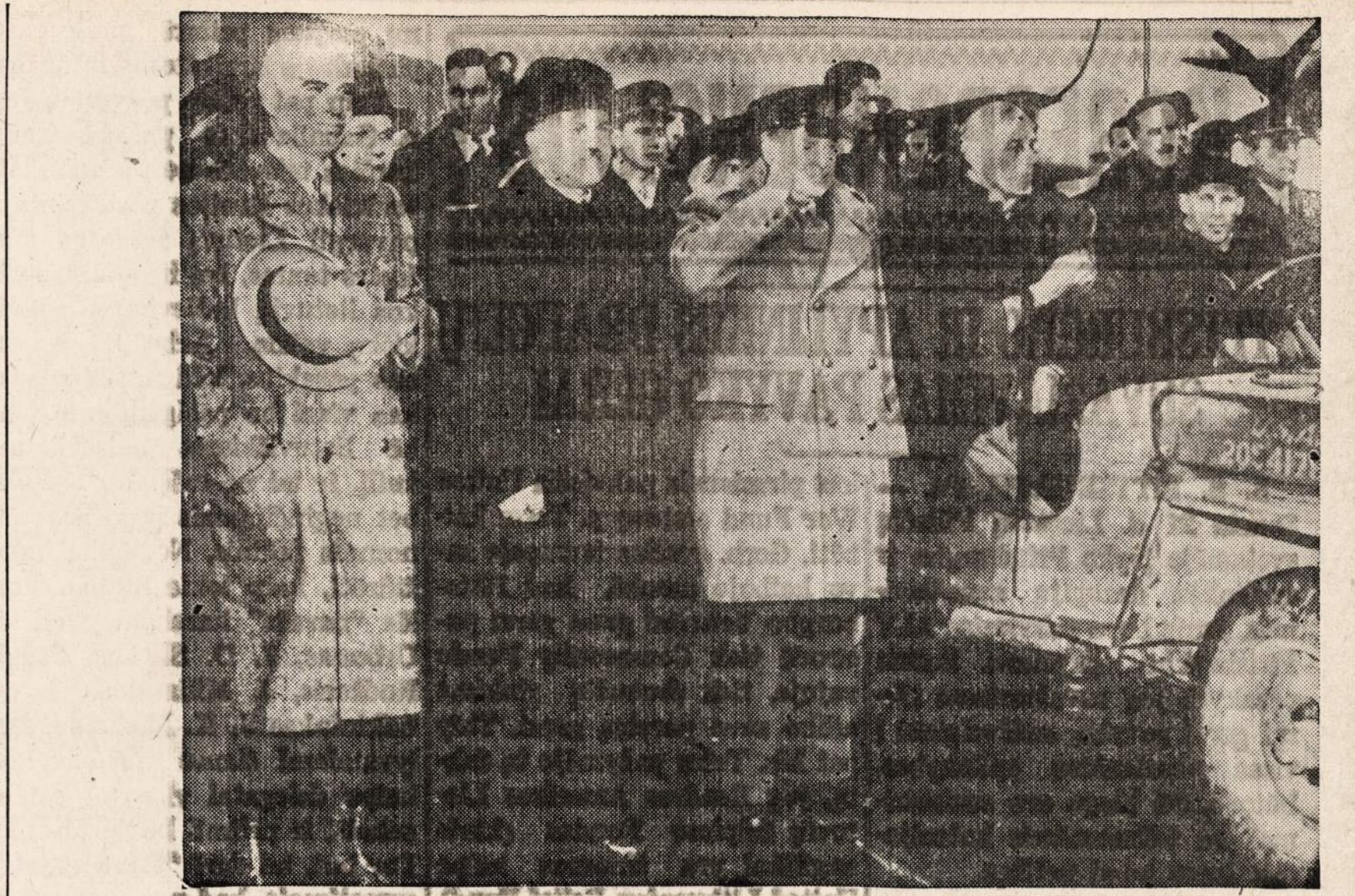
Prezidentas Rooseveltas, premjeras Churchill, užsienių reikalų Komisaras Molotovs ir J. V. sekretorius Edward Stettinius, Jr. Jaltos aerodrome, kur buvo sugrotas Sovietų himnas.

Konferencija jau praėjo ir apie jos rezultatus yra paskelbtas oficialiame pranešime, po kuriuo stovi Churchillo, Roosevelto ir Stalino parašai. Per-