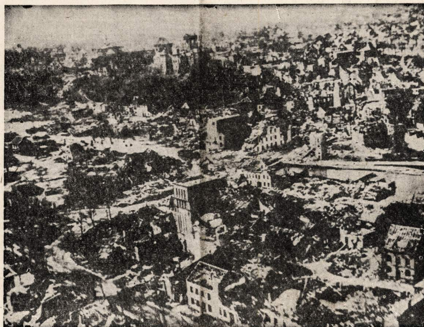
Sudaužytas ir išgriautas vokiečių Kleve miestas. Dėl jo ėjo atkaklūs mūšiai. Vokiečiai buvo sumušti ir priversti pasitraukti.