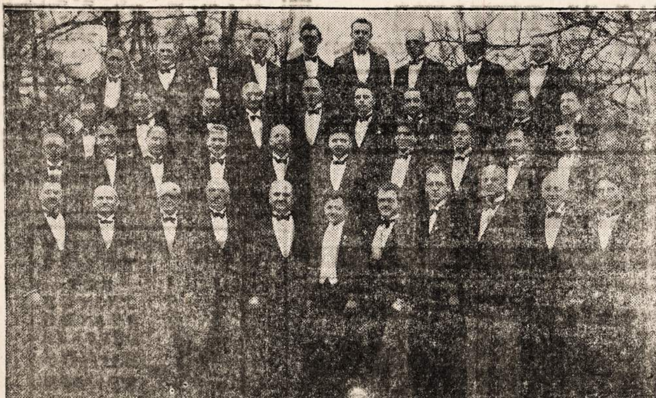
BOHEMIAN SINGING SOCIETY—LYRA