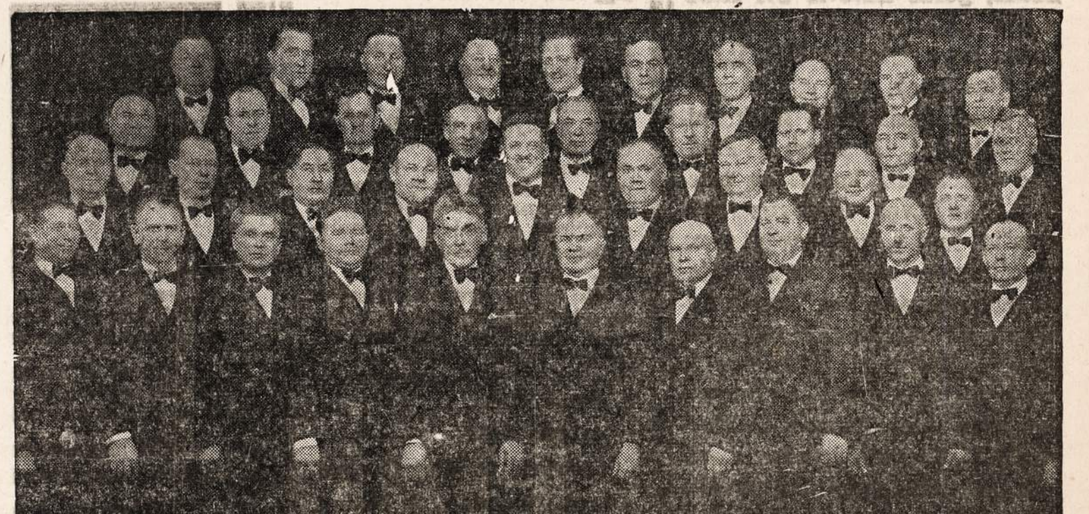
CHICAGOS LIETUVIŲ VYRŲ CHORAS