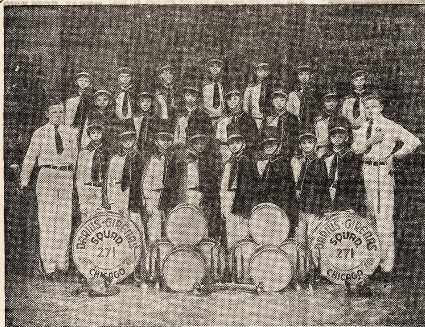
DARIUS-GIRENAS AMERICAN LEGION DRUM AND BUGLE CORPS