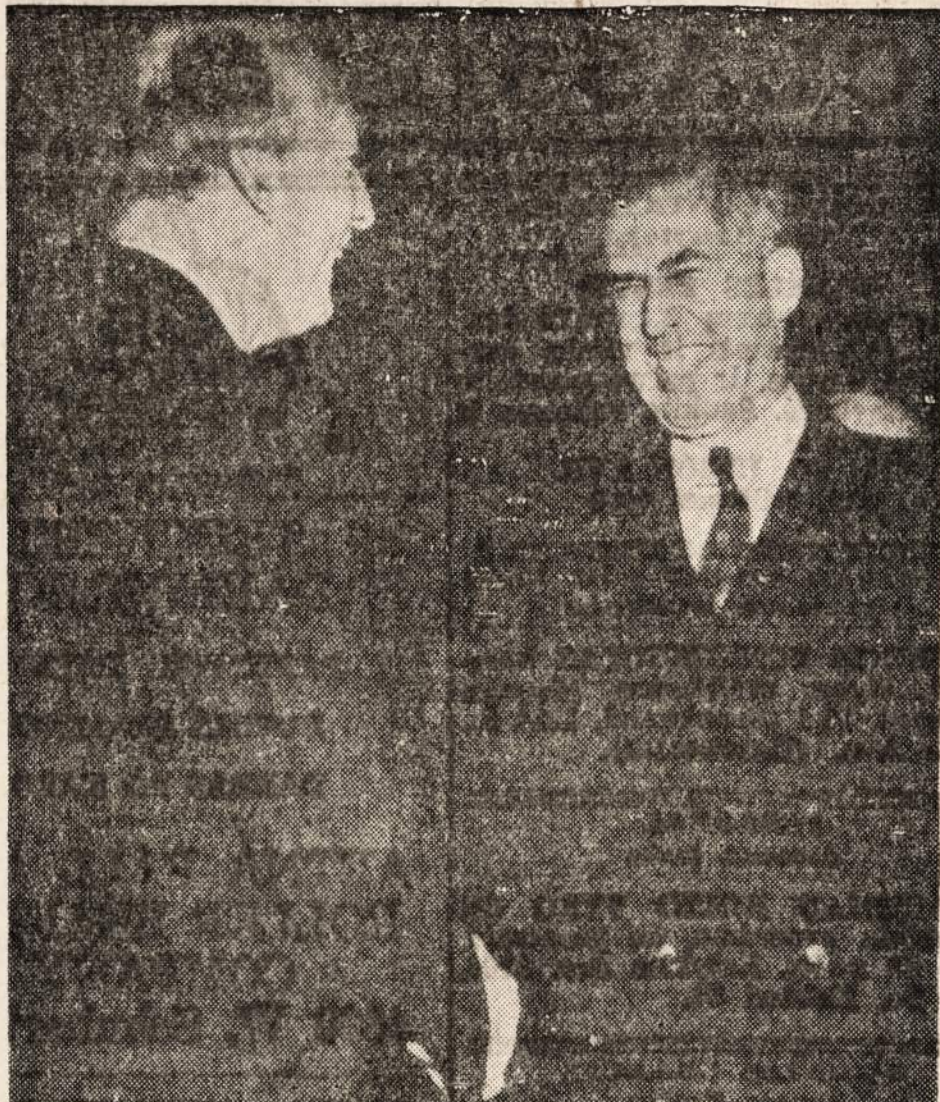
Aukščiausiojo Teismo teisėjas Hugo Black įvesdina buvusį vice-prezidentą Henry A. Wallace į prekybos sekretoriaus vietą. Dėl Wallace nominavimo Senatoje aštri kova.