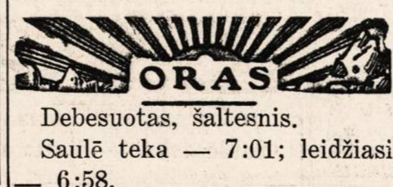
Debesuotas, šaltesnis. Saulė teka — 7:01; leidžiasi — 6:58.

Iš viso, streikuoja 17,000 įvairios rūšies technikų, bet darban nutarė grįžti tik 900. Manoma, kad valdžios įstaigos bus priverstos įsikišti šį streiką, nes darbininkai patys nesusitaria.