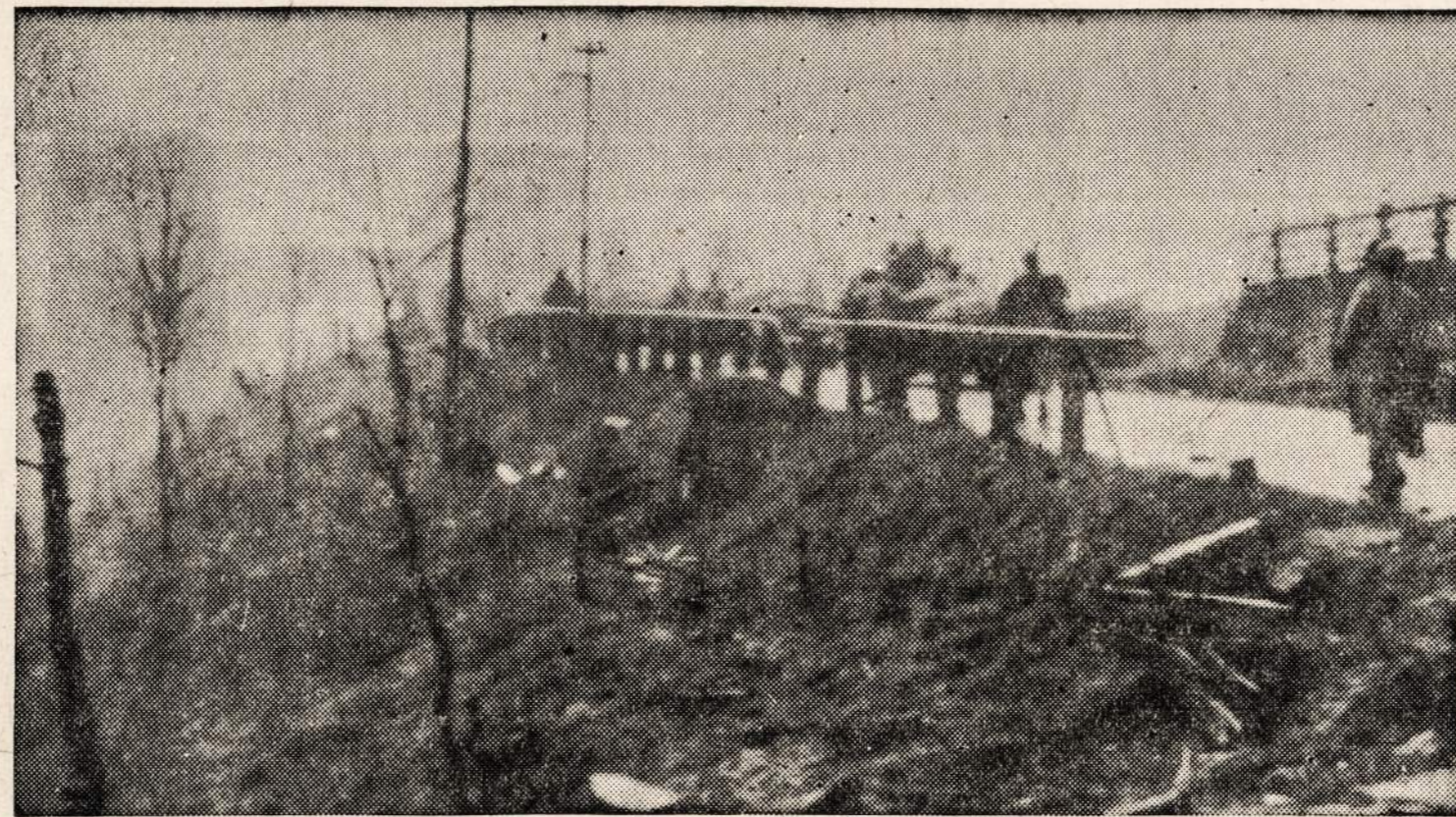
Amerikos kariuomenė eina per Ludendorff tiltą į kitą Reino upės pusę prie Remageno. Vokiečiai buvo taip ūmai užklupti, kad nebespėjo tilto sunaikinti.

Parkas, kuris čia pasižymi, savo didumu, tai rodos—Parque Quinta da Boa Vista. Šiame parke stovi Tautos Muziejus. Muziejų yra daug Brazilijos praeities turty: istorinių, zoologinių, geologinių, archeologinių, botanikos ir kitų kolekcijų; patraukia dėmesį du didžiuliai meteorų gabalai, vienas sveriantis net apie tris tonus, kitas kiek mažesnis; abu jie rasti Brazilijoje. Po Parque Quinta da Boa Vista eina Praca da Republica, Campo de Santa Anna, Campo de Sao Christovao ir desėtkai matančiai ir tūkstančiai banistų. Didžiausia ir gražiausia praja, yra Copacabana turinti net 6 kilometrų ilgio ir yra puslankio formos. Pakraštį šios prajos tęsiasi ir Avenida tuo pat vardu, kuri, kaip ir kitos svarbesnės gatvės, labai iluminuota. Šalimai pristatyta puiki moderniškausių namų, nėra labai aukštų, tai nuo 5-10 aukštų, daugumoje viešbučiai, ca-