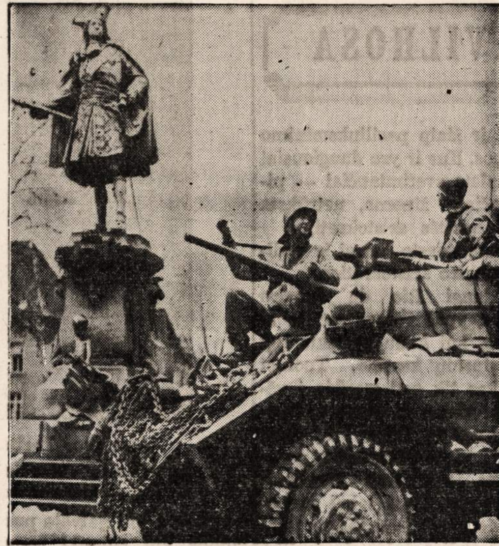
Amerikiečiai žiūri į Friedricho I paminklą Moers mieste.

The American Fat Salvage Committee išpėja visuomenę, jogei rinkimas riebalų liekanų Amerikos namų virtuvėse pasilieka taip opiai reikalingas, kaip kad buvo praieity. Šeiminkės prašomos rinkti riebalus.