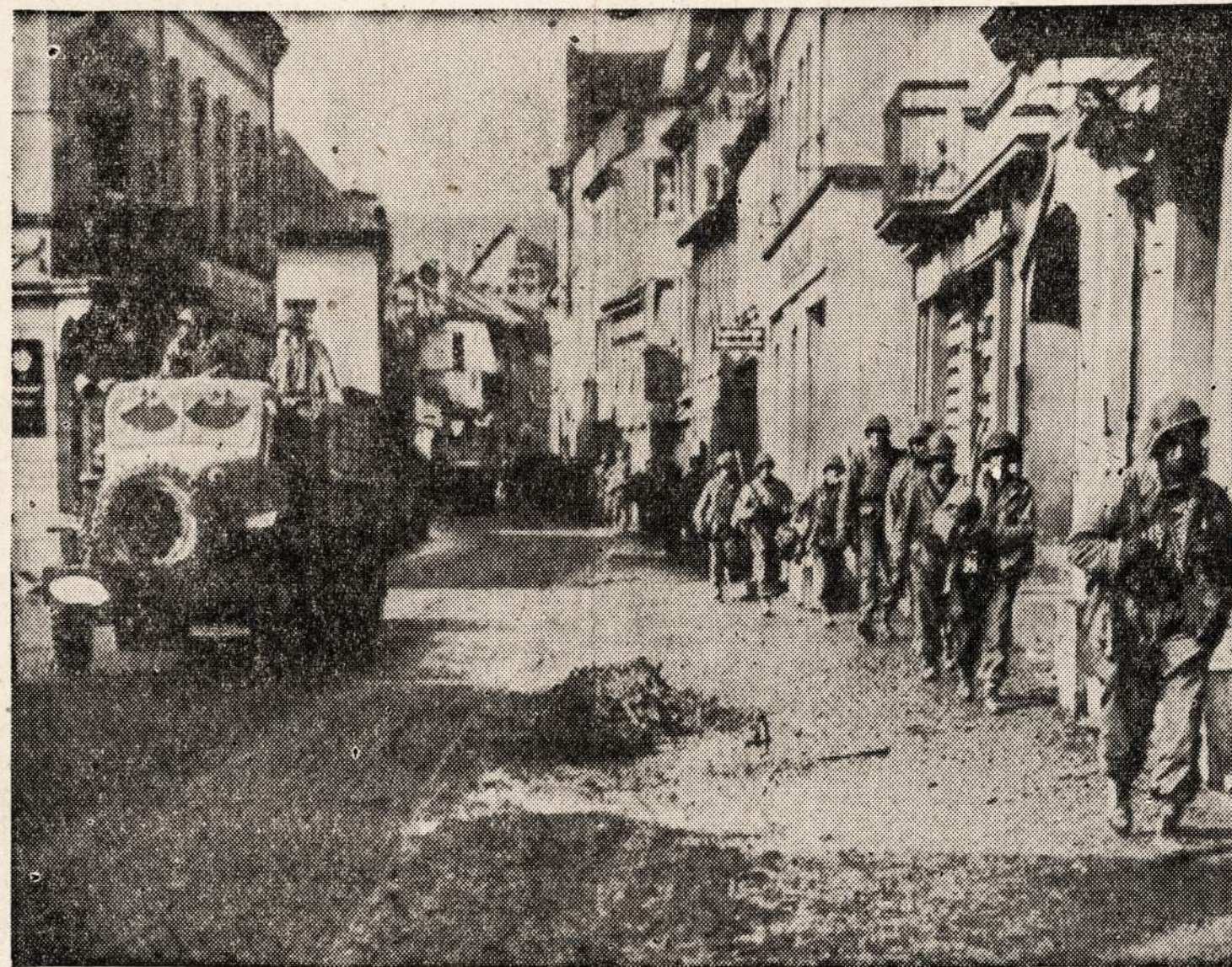
Amerikos 1-os armijos infanterijos daliniai Remagene laikosi arčiau trobesių, kad tuo būdu galėtų apsisaugoti nuo priešo artilerijos.