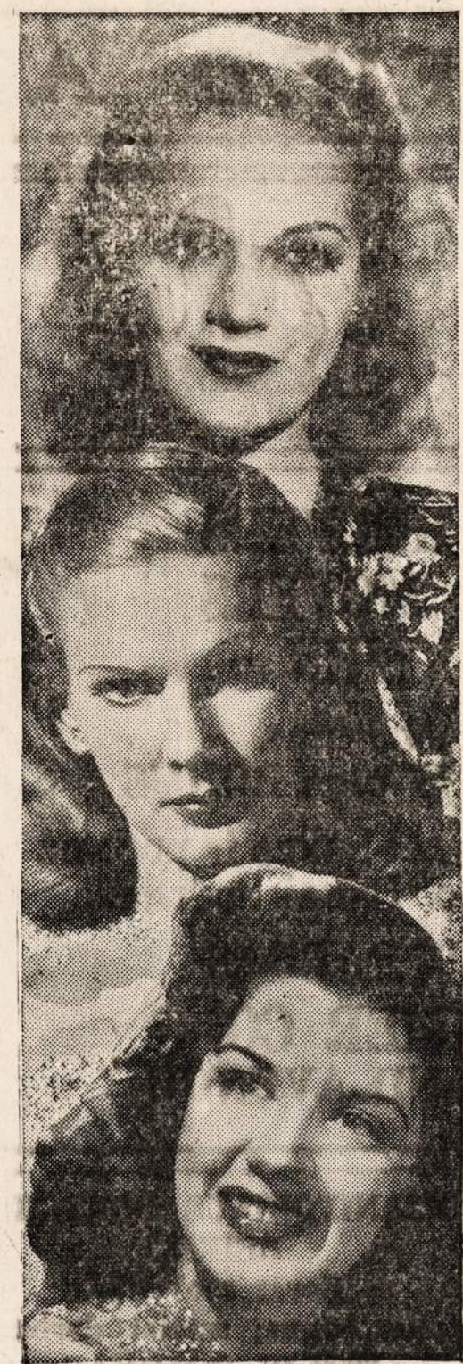
HERE COME THE CO-EDS (1E) Šios trys mergaitės dalyvauja lošime

—Kur čia tau užsnūsi! Rytoj turiu su pranešimu eiti pas ministrį. Reikia apgalvoti, pranešimo projektas paruošti.