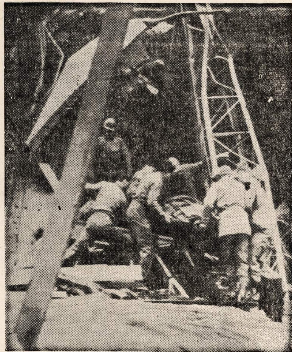
Pirmos armijos inžinierius įkrito į upę, kai susmuko tiltas per Reiną. Įkritusiam į vandenį kariui yra teikiama pagalba.

Be to, prakalbose bus pakviestas vienas iš įžymiausių CCF vadų kalbėti. Šie metai