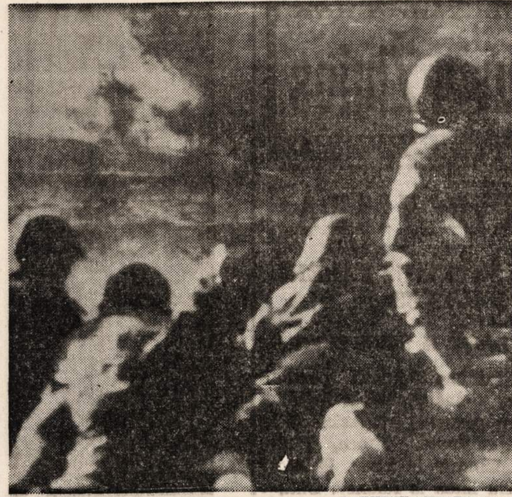
Dumų debesys kyla iš mineralinio aliejaus rafinavimo įmonės Saarbrücken priemiestyje.

Sovietų valdžia pradėjo pasitarimus su atvykusiais čekų atstovais.