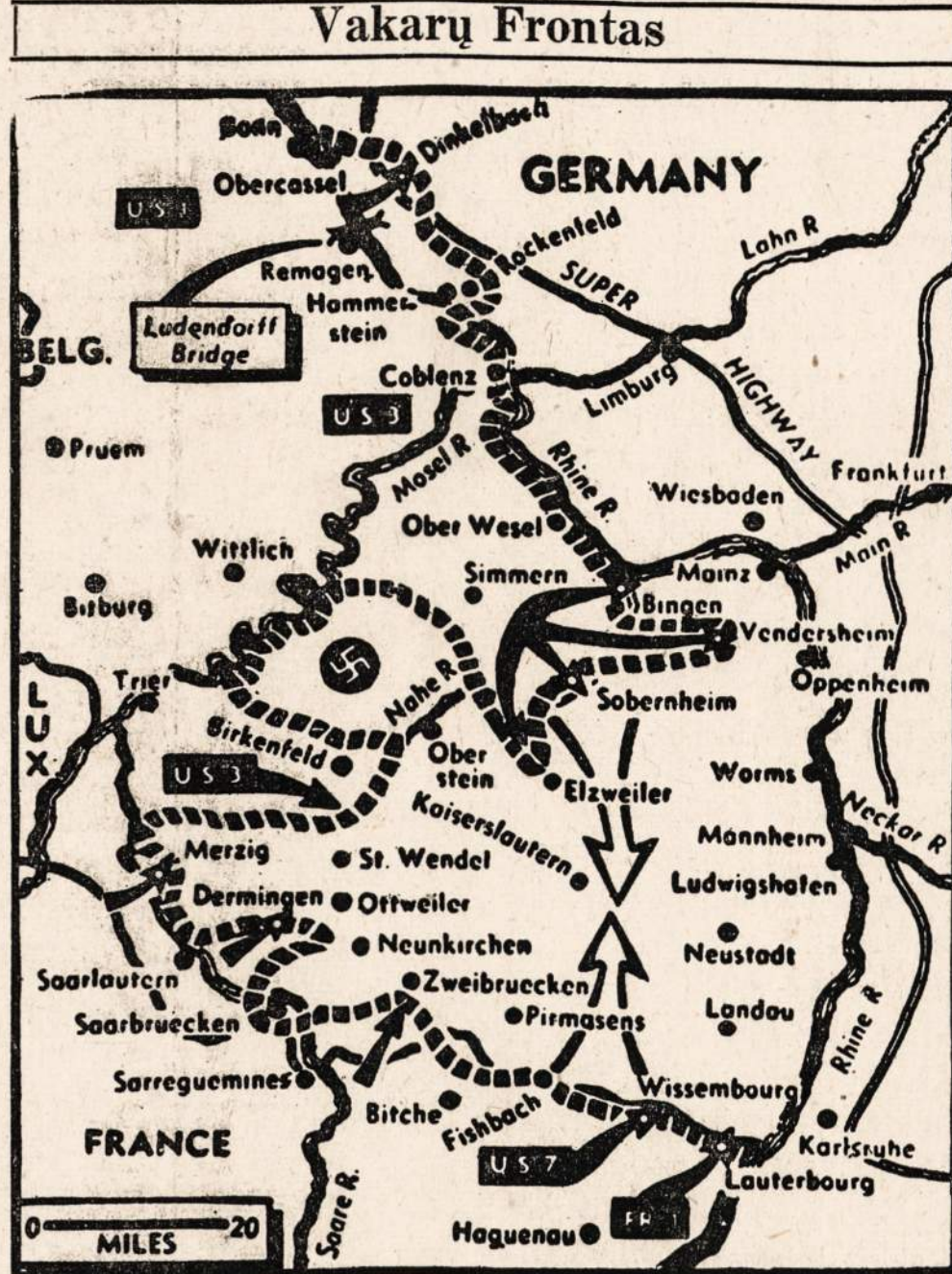
Gen. Patton'o armija sutriuškino ne tik Siegfried, bet ir antrinę Hunsbrueck liniją Saar ir Palatinatė srityse. Kitos Amerikos armijos irgi žygiuoja pirmyn.

J. Valstybės aiškiai pasakė Maskvai, kad jos nepatenkintos lenkų klausimo vilkinimu ir pareikalavo visą šį reikalą skubiai išspręsti. Sovietų valdžia nenori kvesti Mikolajczyko.