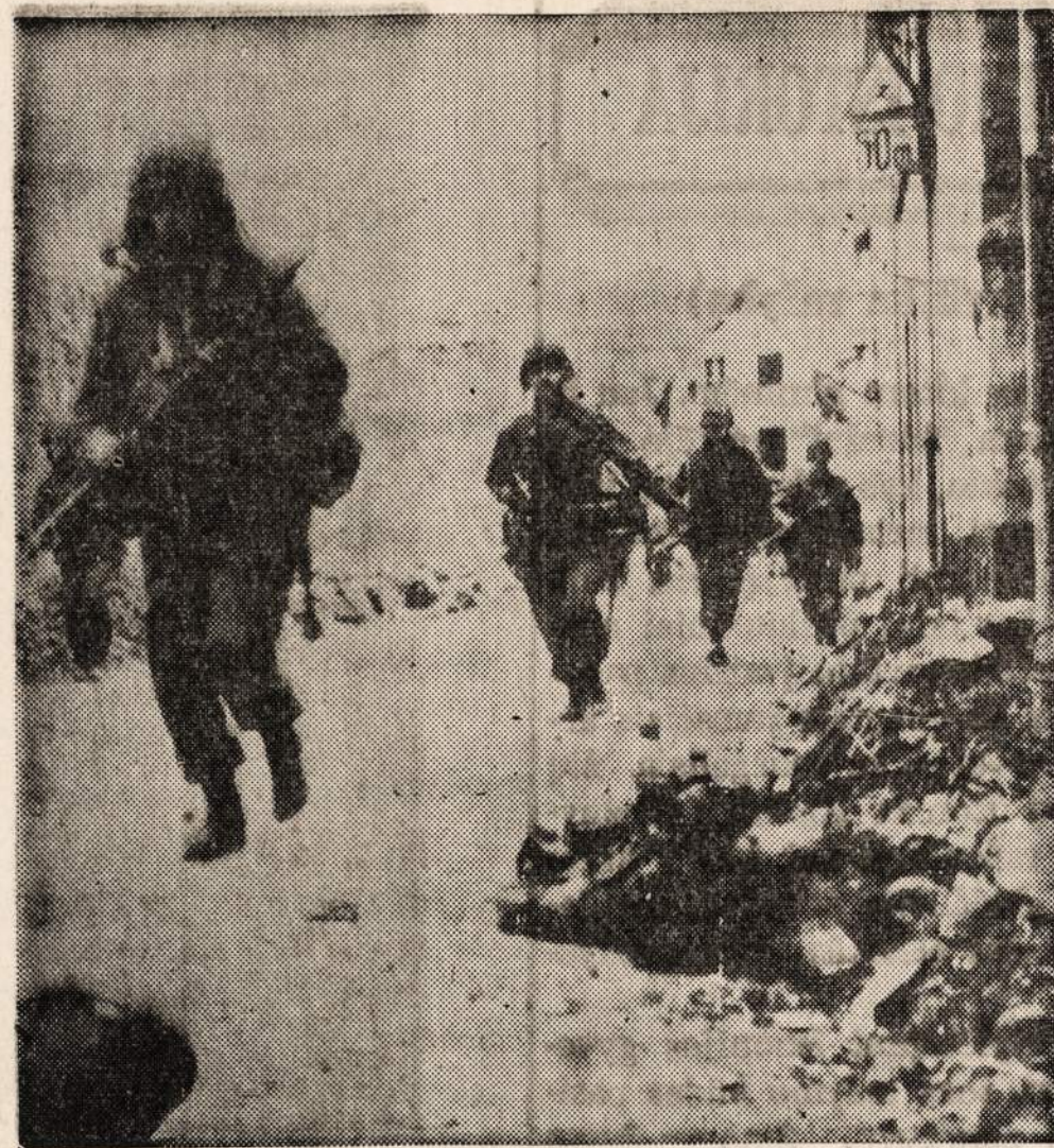
Gen. Patton'o 3-ios armijos kariuomenė praeina pro šalį savo žuvusio draugo prie Coblenzo.

— Italijoje amerikiečiai išiveržė į Latorre miestelį, sako štabas.