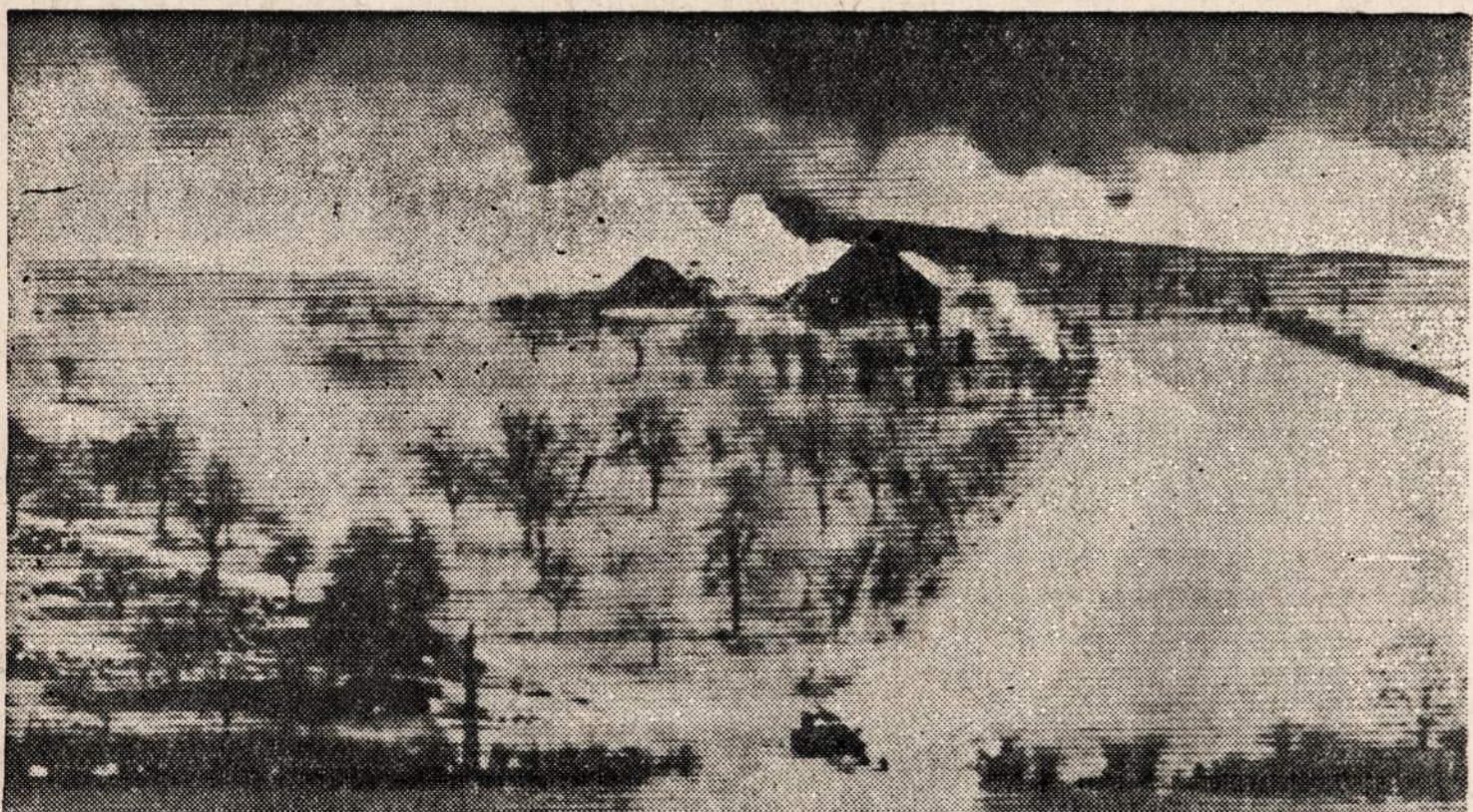
Amerikos 9-ji armija leidžia dūmus, kad tuo būdu galėtų paslėpti nuo priešotų vietas, kur kariuomenė buvo rengiama persikelti per Reino upę.