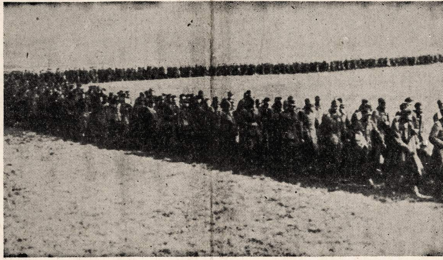
Gen. Pattono 3-ios armijos į nelaisvę paimti vokiečiai yra siunčiami į užfrontę