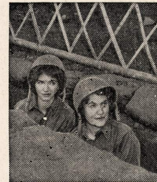
SLIT-TRENCHES are part of life on the Ledo Road, especially for these Red Cross girls who were among the first to go "up the Road." Right: Quaint Burmese buildings house Red Cross clubs along the Road. Here, Red Cross girls serve refreshing drinks at a wayside stop to a couple of American soldiers.