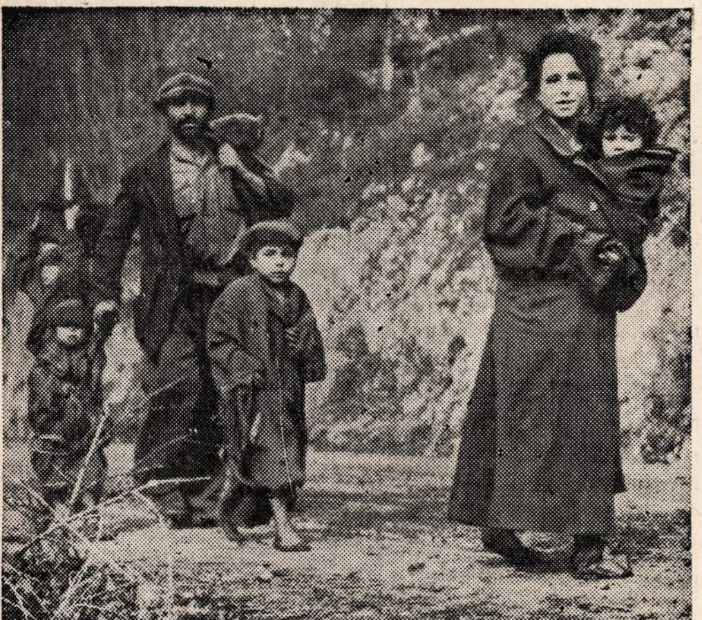
Taip rengiasi nacių apiplėšti Europos gyventojai. Matyti, iš kokie žuvusio nacio moteris nusavino apsaustą Drabužių rinkimo vaju Europos gyventojams prasidėjo. Aukokite, ką galite ir tuo būdu prisidėkite prie nelaimingų žmonių apgengimo.

Desplaines upėje, arti Park Ridge, rasta kūdikio mergaitės lavonas. Jisai buvo suvyniotas moteriškoje mėlynoje marškoje dėvimoje namie. Bet kokios žymės, pagal kurias galima būtų nustatyti kam marška priklauso, panaikintos. Policijos manymu mergaitė buvo keturių ar penkių dienų senumo kai mirė.