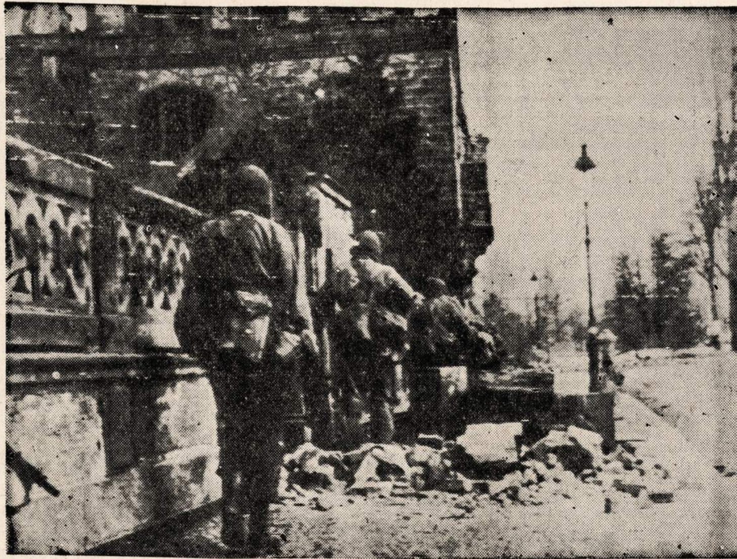
Amerikos ?-ji armija okupavo beveik visą Frankfurt-on-the-Main miestą.

Skelbimai Naujienose duoda naudą dėlto, kad pačios Naujienos yra naudingos