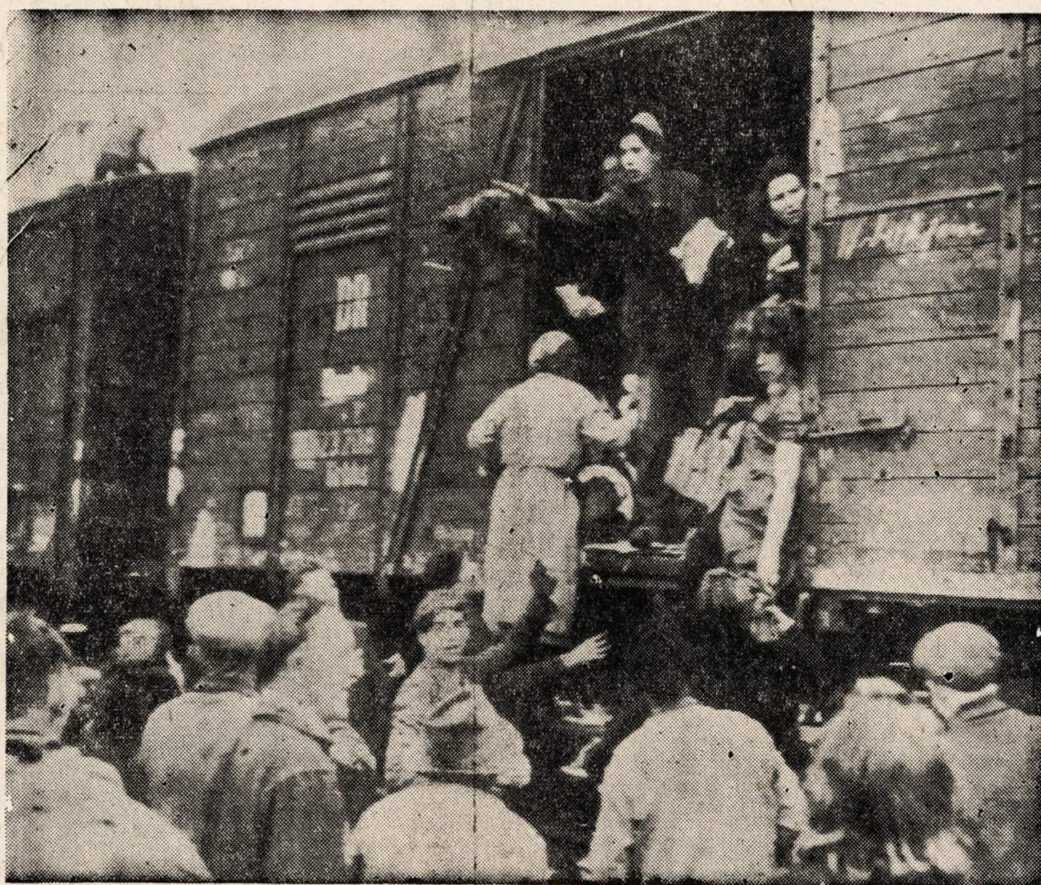
Vokiečių civiliai gyventojai, netekę maisto išteklių, pradeda ieškoti jo prekybiniuose vagonuose.

ryžę taikytis su sąjungininkais, bet jie pareikalavo, kad Hitlerio valdžia atsistatydintų.