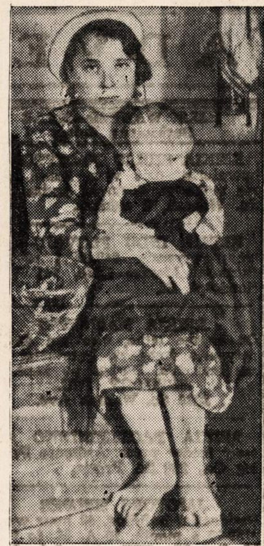
Šis paveikslas buvo nutrauktas kažkur Lenkijoje, kur milijonai žmonių badauja ir vartoja skurlius vietoje drabužių.

Didžiausią gėdą visai "pažangųjų" — trečiafrontininkų rašytojų grupei padarė Venclova su Cvirka (jiedu buvo šios grupės dyšios vadais), kai jiedu sutiko eiti Lietuvai užkarto "seimo" sekretorių pareigas. Jiedu aiškiausiai žinojo, ku-