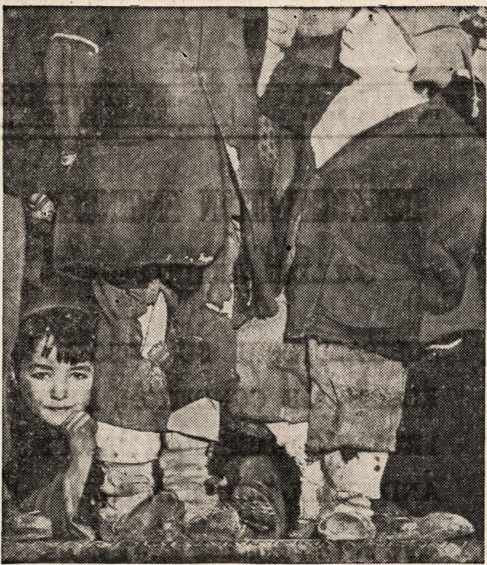
Tai tokiais drabužiais yra aprengiami Europoje vaikai. Po penkių su viršum metų karo drabužių išteklių visiškai išsibaigė.