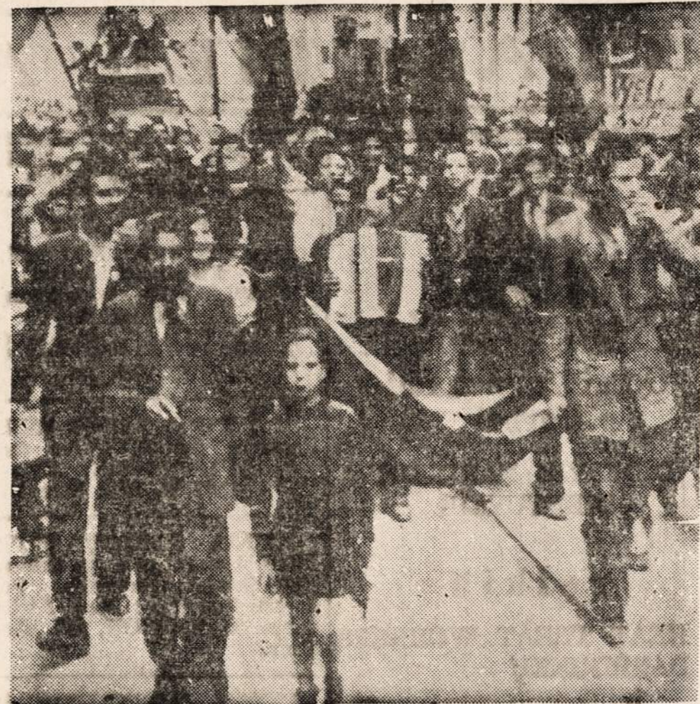
Išlaisvinti Italijos miesto Bologna gyventojai entuziastiškai pasitinka Amerikos kariuomenę.