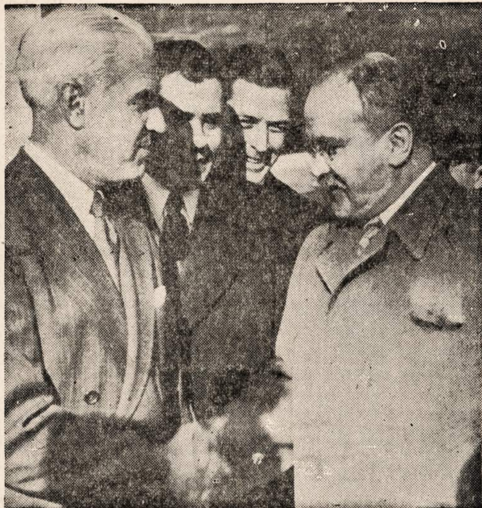
Valstybės sekretorius Edward R. Steltinius (po kairei) pasitinka Rusijos užsienių reikalų komisarą V. M. Molotovą (po dešinei) Washingtono skraidykloje