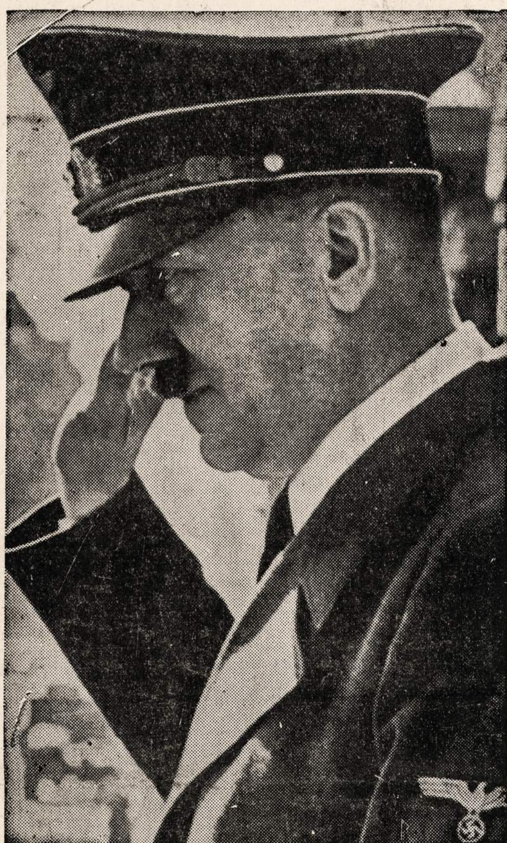
Vakar Berlyne užmuštas vokiečių vadovas.