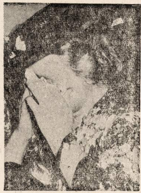
Motery reagavimas kaip UNCIO žiurovių San Francisco mieste, kai buvo partirta, jog gandai apie Vokietijos pasidavimą yra klaidingi.

mato juice. 4 šaukštai miltų mažą svoguną mažą morką. Parudinkit pot roast karštame salad oil. Dadėkit česnaką, marjoram arba thyme, actą, pusę puoduko vandens, druską ir pipirus. Uždenkit kietai ir virinkit dvi valandas. Dadėkit tomato juice ir virinkit dar vieną valandą ilgiau. Svogunai ir morkos turi būti verdami atskirai. Padėkit mėsą ir daržoves ant karštos lėkštės. Išimkit česnaką. Padarykit košelę iš 4 šaukštų miltų ir supilkkit likusį vandenį. Sumaišykite ir virkite iki sukietės.