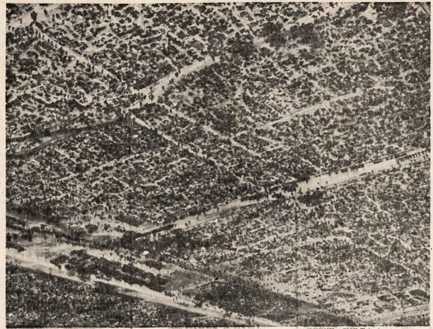
Sajungininkai tikrai "pasišienavo", kai į jų rankas pateko 160,000 vokiečių. Šis paveikslas buvo nutrauktas iš lėktuvo kažkur Vokietijoje.