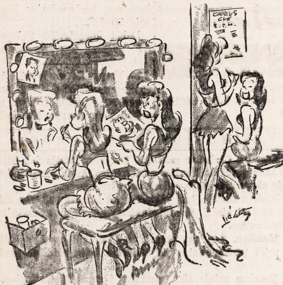
"Mr. Snodgrass may be fat and bald, but he's a real patriot. He simply showers me with War Bonds."