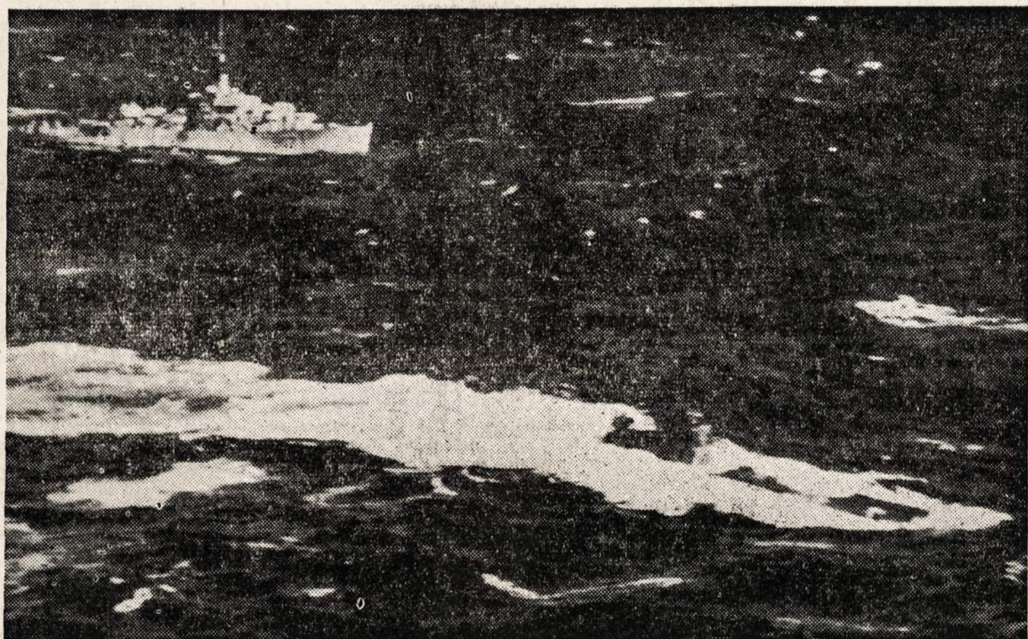
Vokiečių submarinas U889, kuris pasidavė Amerikos R. C. A. F. laivui netoli Sheelburne, Nova Scotia. Tai pirmas vokiečių submarinas, kuris pasidavė prie Amerikos kontinento krantų. Submarinas bus atgabentas į Cape May, N. J.