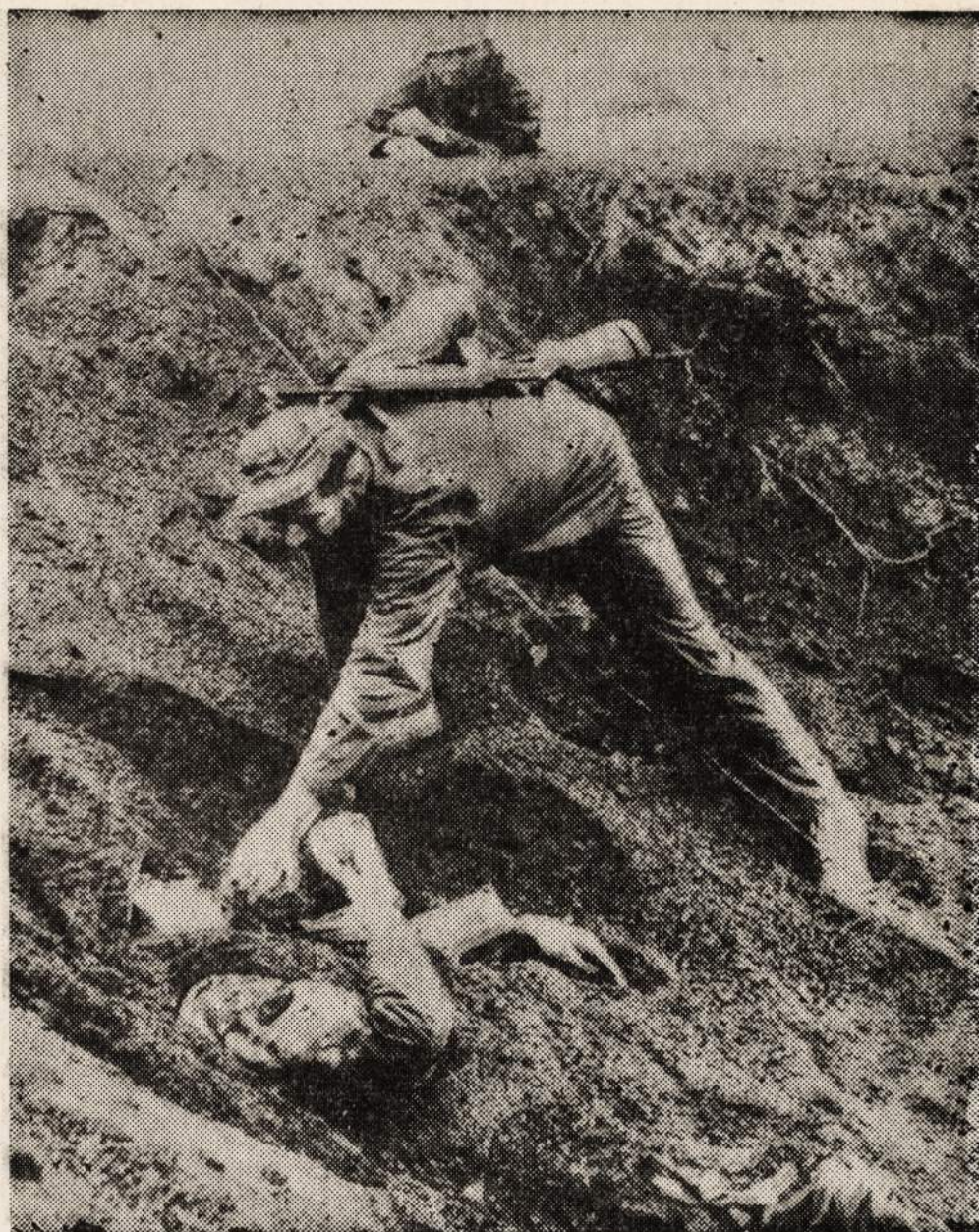
Japonų karys, kuris pusantros dienos apsimetė negyvas Iwo saloje. Amerikos marinas lengvai sužeistam japonui duoda cigaretę. Tas marinas ir pastebėjo, kad japonas tik dedasi negyvas.

O "kron-princas" dar prideda nuo savęs storą melą, pra-