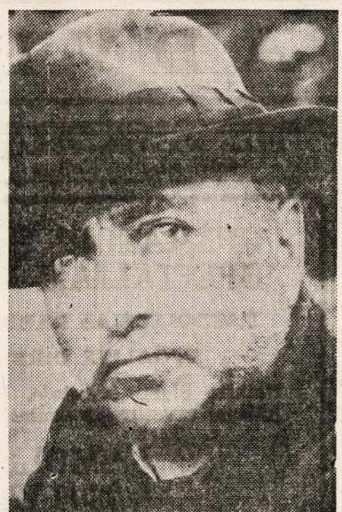
Dr. Robert Ley, 55 metų amžiaus nacių darbo ministras, kurį amerikiečiai pagavo Bavarijos kalnuose. Manoma, kad Dr. Ley buvo pradėjęs organizuoti nacių pogrindžio judėjimą.

Visos trys tautinės grupės turi savo tikinčiųjų tarpe visų didžiųjų rasinių narių. Žydai emigrantai iš Rusijos, prancūzai katalikai atvykę iš Prancūzijos