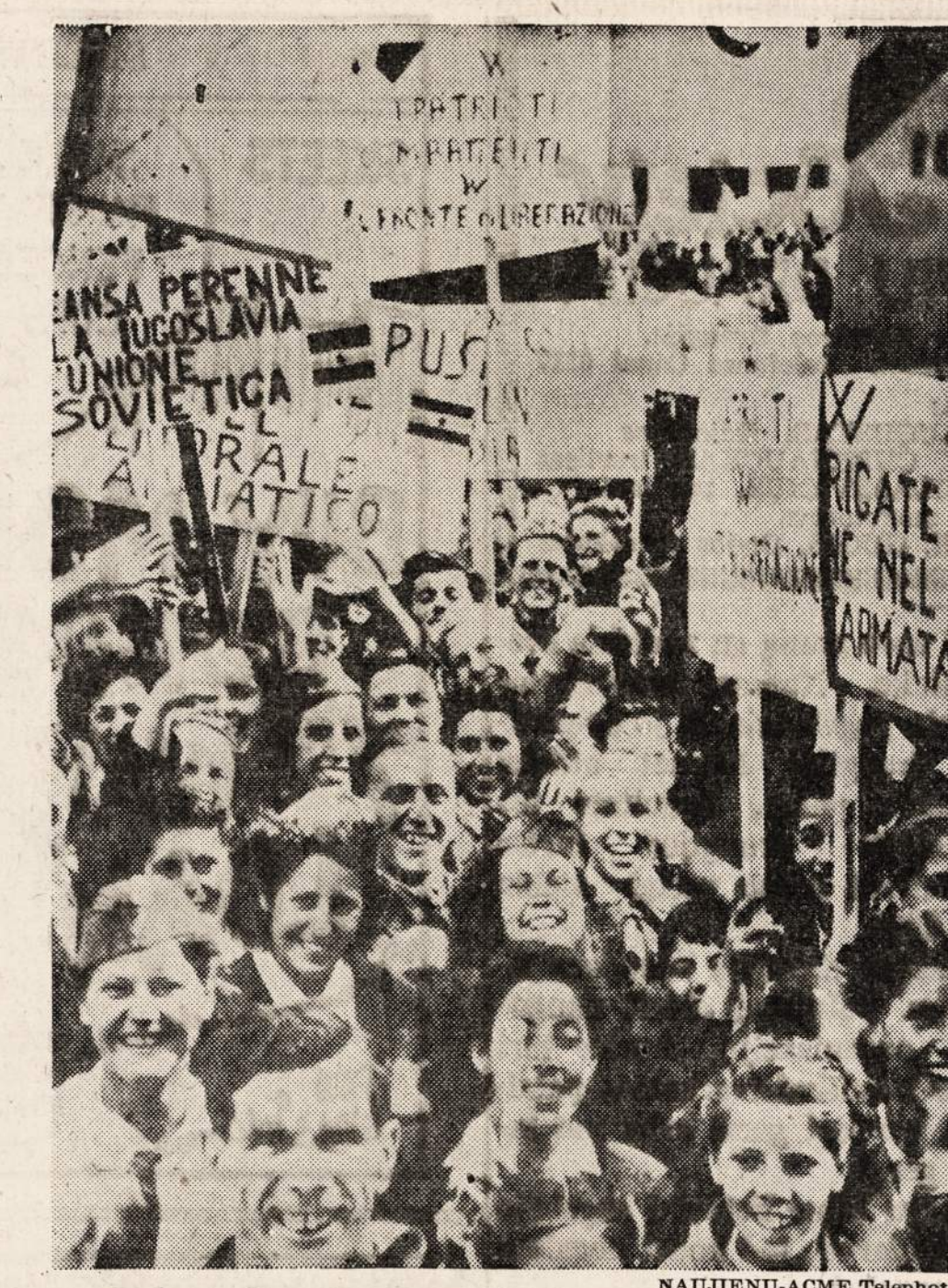
Italu ir jugoslavų patriotai entuziastiškai pasitinka Britų 8-tos armijos dalinius, kurie įžengia į Monfalcone, 15 mylių nuo Trieste.

Jeigu Teheranas ir Jalta buvo “Miunchenai”, tai po Jaltos gali atsistiti panašūs dalykas. Jau šiandien matyt, kad Washingtonas ir Londonas nėra linkę eiti toliau nuolaidų keliu.