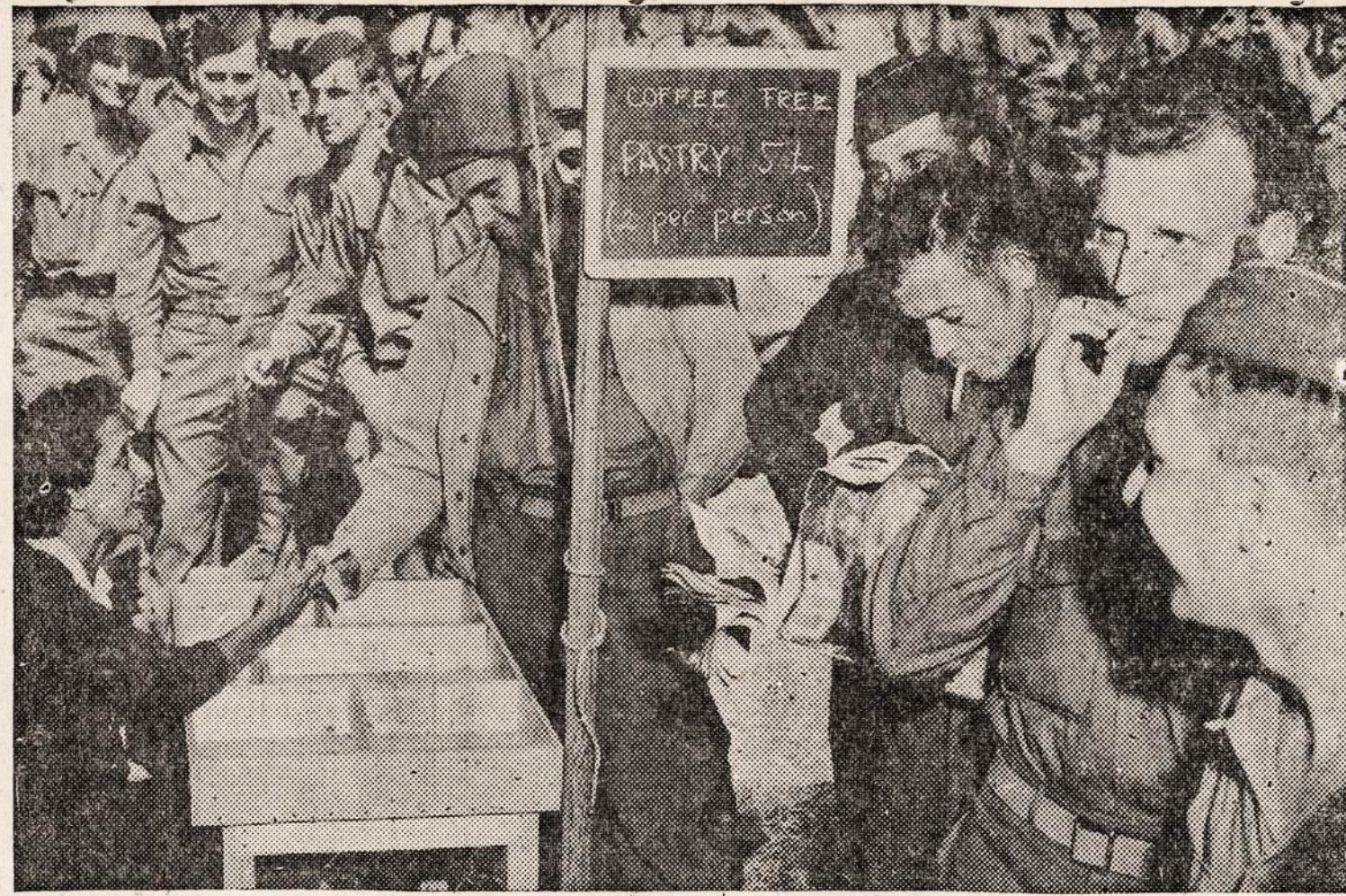
CIRCUS TENT SNACK BAR, part of a 27-tent portable American Red Cross club in Italy, welcomes servicemen of the Fifth Army. Here, one of the six Red Cross girls in charge of recreation hands out snack and tchets. Pastry, purchased locally, is available at less than cost, for about five cents; coffee is free.

Praityje pavasariui besibaijant, kai oras atšildavo ir prasidėdavo saulėtos dienos, tai draugijos rekorduose ligonių skaičius žymiai sumažėdavo. Visai kitaip yra šiemet: skaičius ligonių yra žymiai didesnis, negu būdavo paprastai šiuo metų laiku.