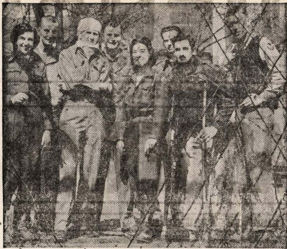
PRISON WIRES CUT—Barbed wire enclosing this German prisoner of war hospital is no longer a barrier to freedom for American servicemen. Shown with them are two Red Cross cismobile girls whose arrival followed liberation by allied forces.

Tačia proga viešnia pasimatė su savo giminėmis ir kitais pažįstamais, kuriems nori padėti už atsilankymą ir išklausymą mišiu sūnaus atnūnimui. — VBA