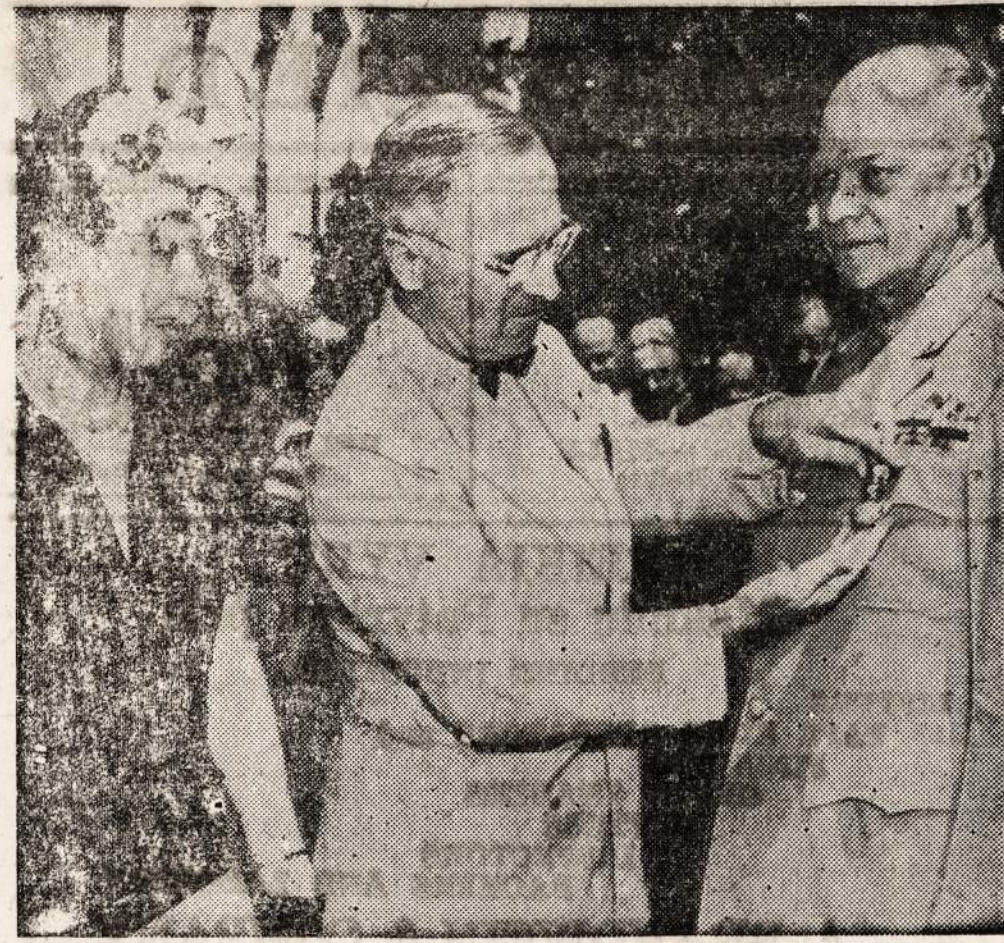
Prezidentas Truman įteikia generorui Eisenhower trečią medalių už pasizymėjimą tarnyboje.

Luebeck's tortuous thoroughfares extend from the city's old gates. Lanes and alleys leading to the river front are full of the city's gabled past. The spire of St. Peter's church overlooked the market square, bordered on two sides by the low, gabled Town Hall, where representatives of more than 80 Hanse cities had debated their common welfare. The best memorial to Luebeck's 70 guilds of the 15th century was the old home of the Shipper's Company.