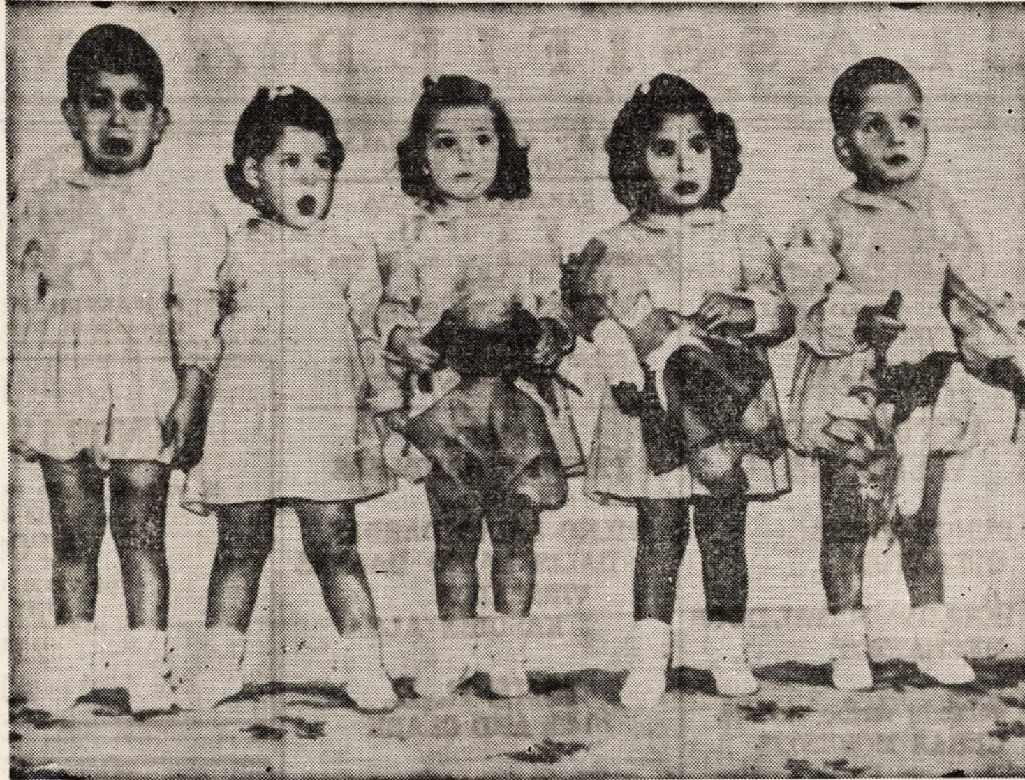
Argentinos penketukai užvakar jau šventė dviejų metų sukaktuves. Tėvai nenorėjo skelbti žinios apie penketukų gimimą, laikraštininkai nieko nesužinojo pirmomis dienomis, todėl vėliau niekas nenorėjo tikėti jų tikrumu.

Išlipome į krantą Glasgowe, Škotijoje, pasitikus mus škotų dudų būni. Iš čia traukiniu nuvykome į stovyklą arti Derby, Anglijoje.