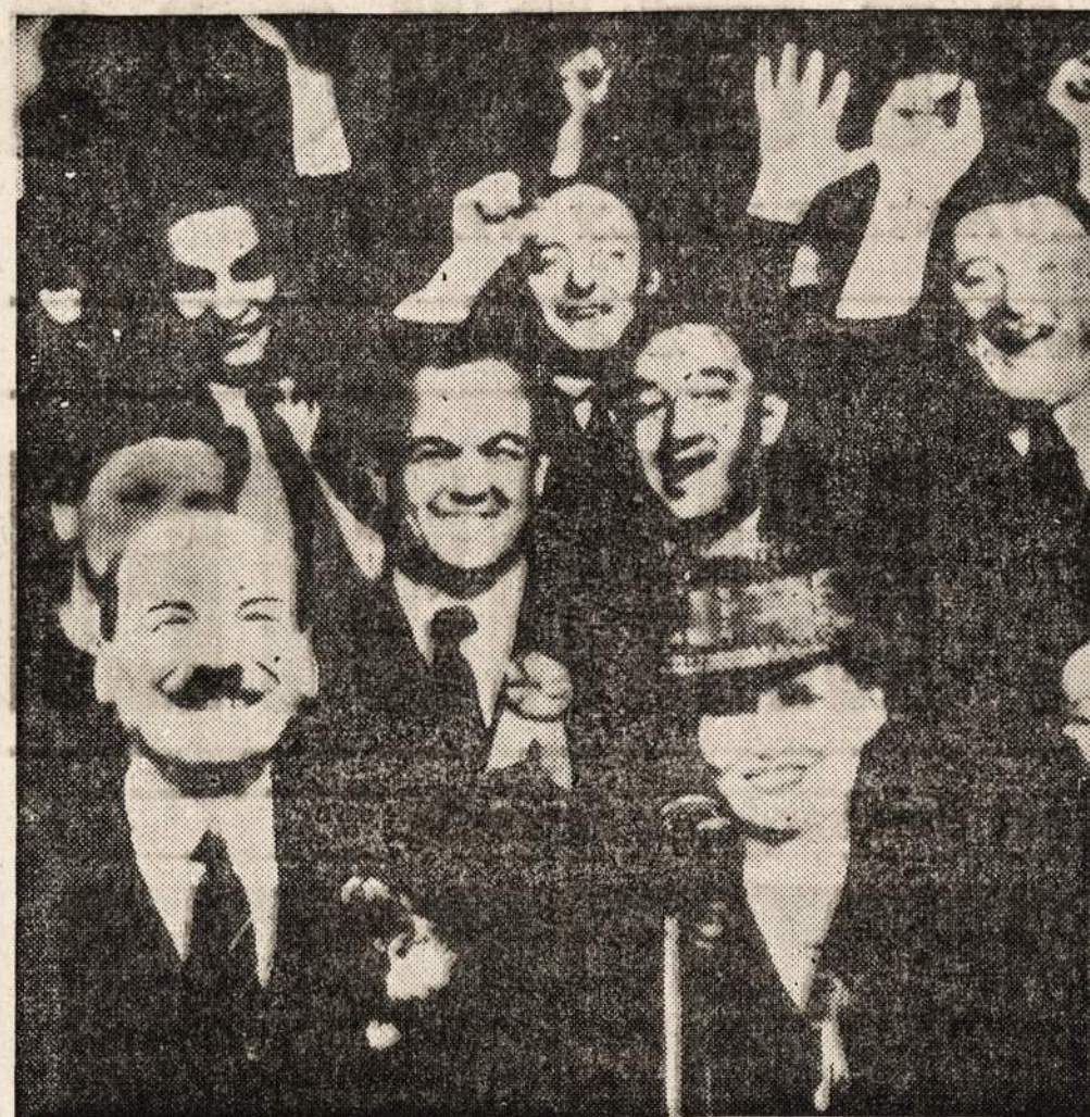
Maj. Clement Attlee, Darbo partijos vadas, ir jo žmona. Londono gyventojai naująjį premjerą pasitinka su didžiausiomis ovacijomis.

Labai, labai prašau, manytė kitą norit, tik nekad netur-