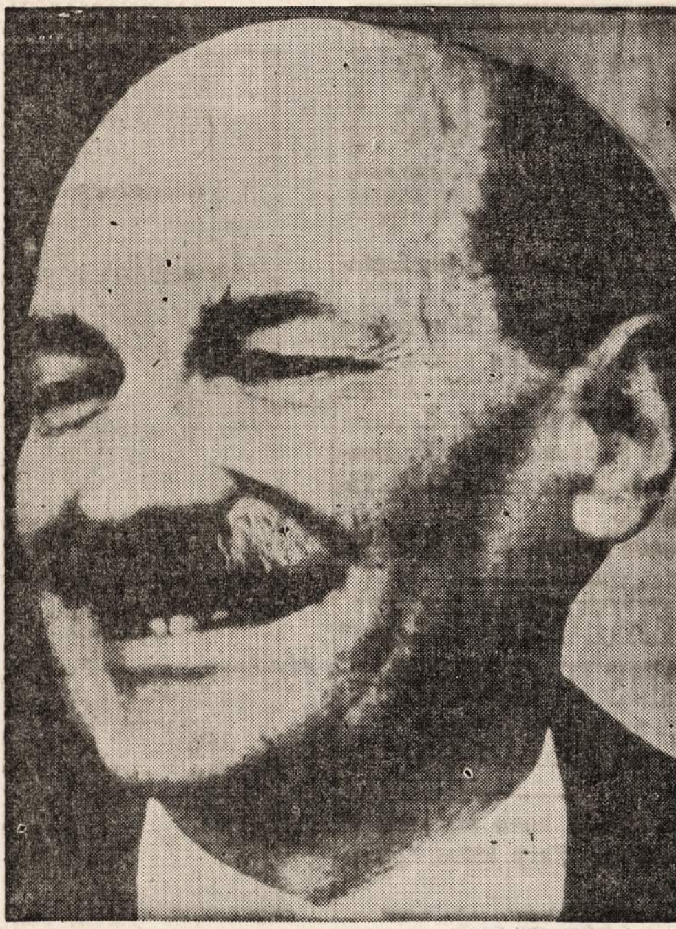
Maj. Clement R. Attlee, Darbo partijos vadas, kuriam Anglijos karalius pavedė sudaryti valdžią.

Pirkite tose krautuovėse, kuriose garsinasi "NAUJIEOSE"