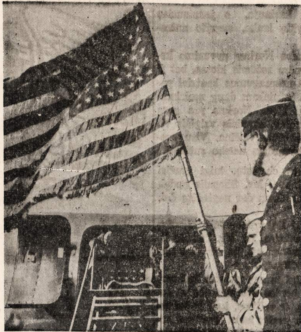
Maj. Richard I. Bong kūnas buvo pargabintas lėktuvu į Duluth, Minn. Bong, vienas iš labiausiai išgarsėjusių lakūnų, žuvo "jet" orlaivį babandydamas.