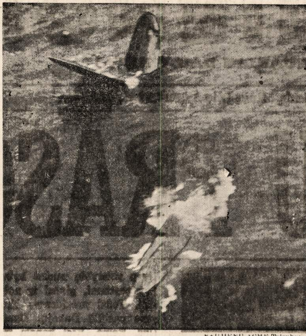
Čia matosi "Hawaii Mars", didžiausias pasaulio lėktuvas, kuris nukrito į jūrą netoli Love Point, Md. Pavėsklas buvo nuimtas po to, kai tas lėktuvas nukrito į vandenį, iš kurio yra išsikūsi uodega ir vieno sparno dalis. Daromi planai nuskendusį lėktuvą, kuris sveria 72 tonas su viršum, iš vandens ištraukti.