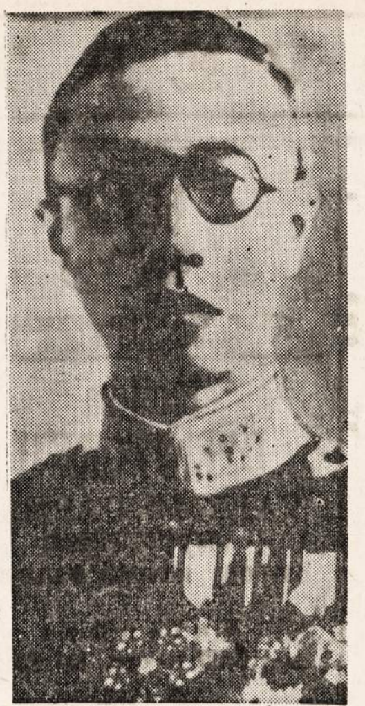
Imperatorius Kung Teh, japonų paskirtas marionetinis Mandžurijos valdovas, kuris, kaip paskelbė maršalas Vasilevskis, pasidavė rusams.

Amerikos karo vadovybė uždraudė labiau pasižymėjusiems naciams arba kariškams vadovauti bet kokiam pramonės šakai ir būti biznieriams.