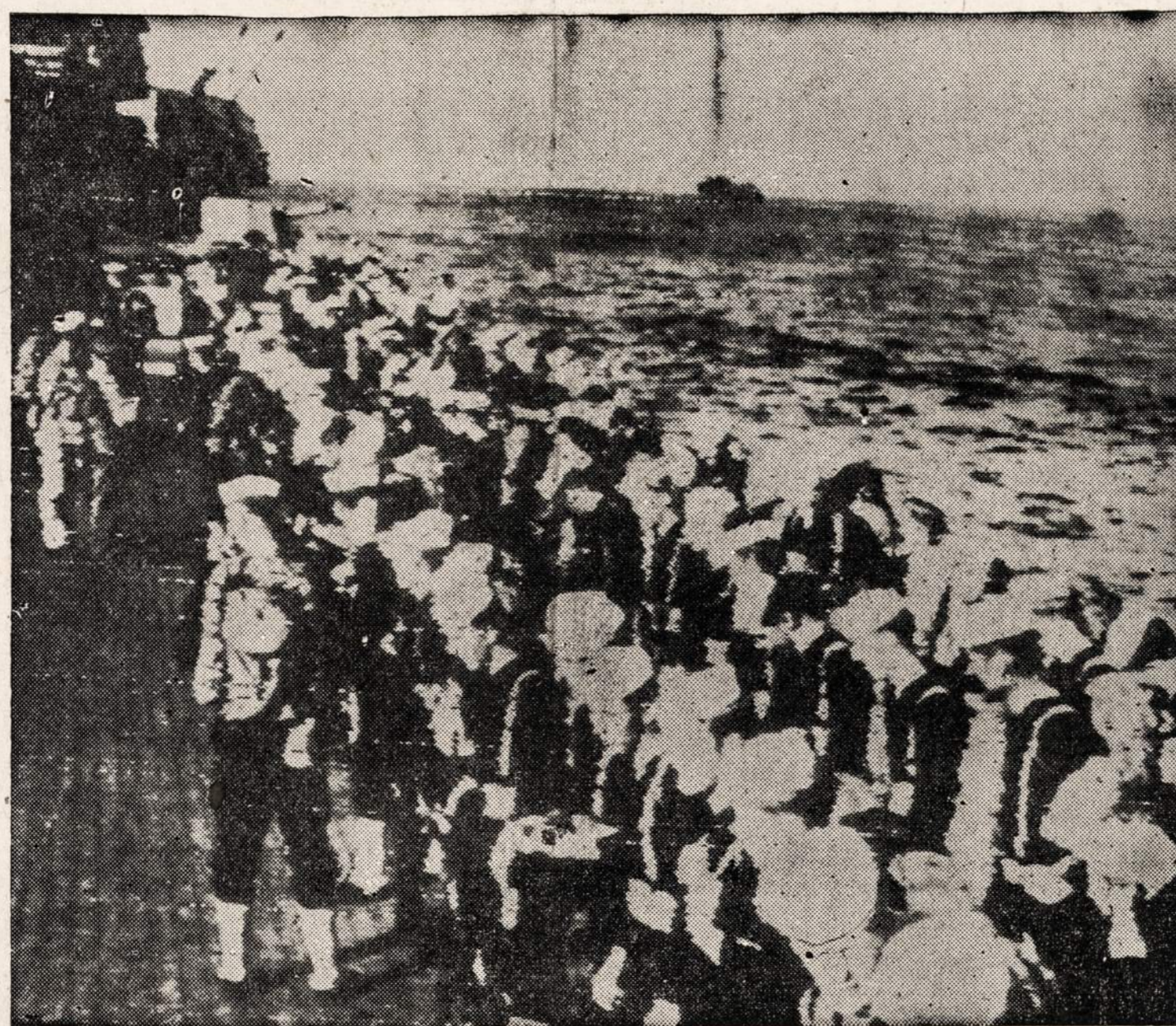
Adm. William F. Halsey pasirėngęs Tokijo okupuoti. Ant vieno didžiųjų karo laivų yra daroma igulos inspekcija.

nai dar priešinasi, bet Port Arthur jau įplaukė rusų laivai, o jūrininkai dainuoja uosto gatvėse.