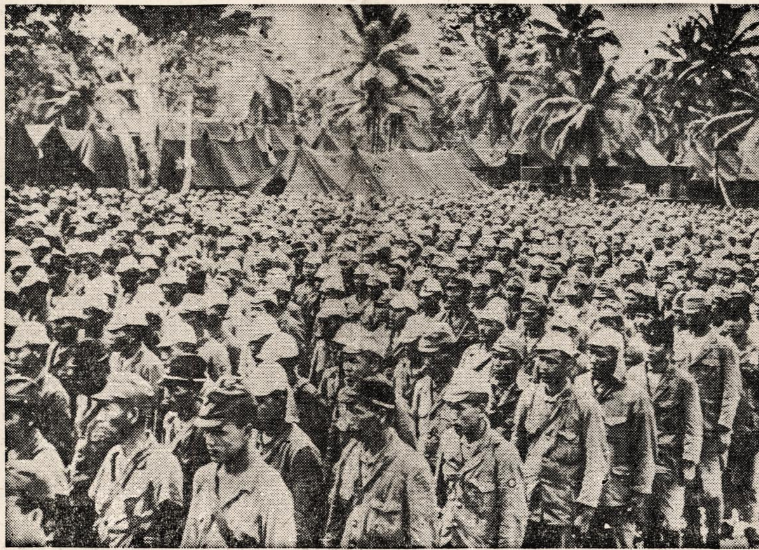
Dvidešimt šeši šimtai japonų, kurie sudarė Rota salos garnizoną, rugsėjo 5 d. pasidavė amerikiečiams ir buvo atgabenti į Guamą.