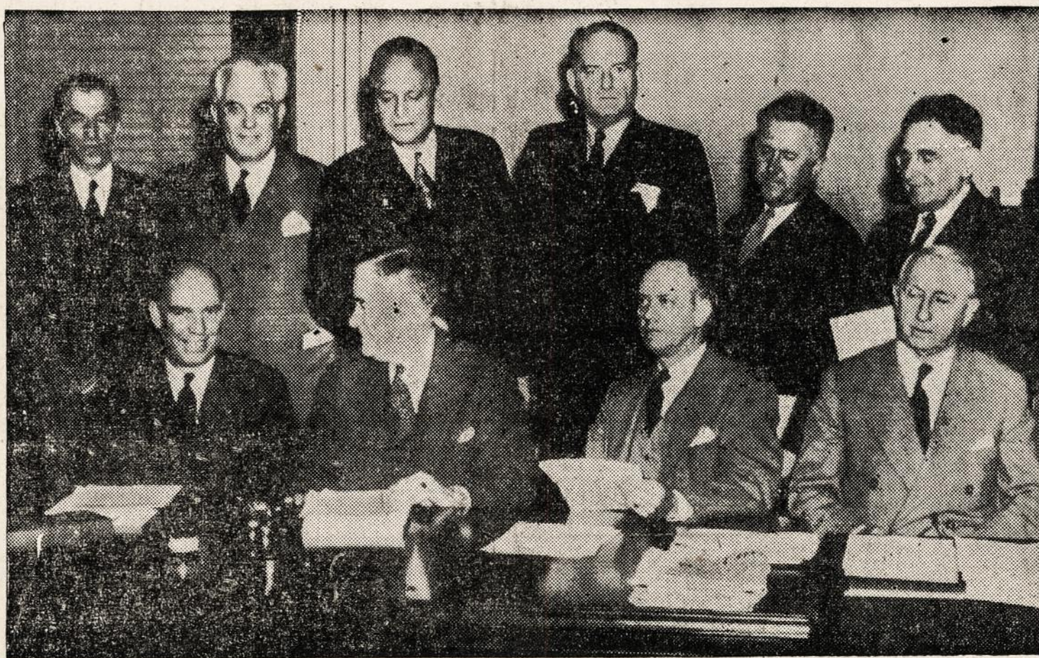
Kongreso komiteto nariai, kurie yra paskirti Pearl Harbor užpuolimo faktus tyrinėti, susirinko pirmam posėdžiui. Sėdi (iš kairės į dešinę): kongresmanas Owen Brewster iš Maine; sen. Alben Barkley iš Ky.; kongr. Jere Cooper iš Tenn.; sen. Walter George iš Georgia. Stovi: kongr. J. Bayard Clark iš N. C.; sen. Homer Ferguson iš Mich. sen. Scott Lucas iš Ill.; kongr. Frank Keefe iš Wis.; kongr. John Murphy iš Pa., ir kongr. B. W. Gearhart iš Calif.