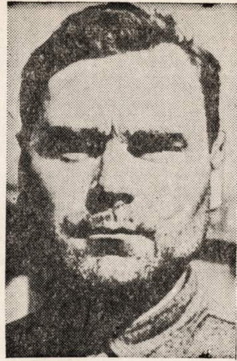
NAUJIENŲ AGENTŲ TELEFONO Joseph Kramel, Belseno žvėris, Britų militariniame teisme yra teisiamas už žvėriškumus, atliktus Belseno koncentracijos stovykloje. Teismas vyksta Lueneburge.