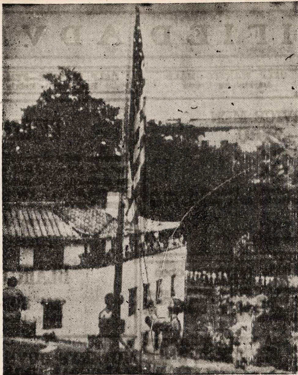
Vėliava, kuri buvo iškelta Casablancaje, Algiers, Romoje, Berlyne ir U. S. S. Missouri laive, kai Japonija formaliskai pasidavė, bei plevėsavo po Pearl Harbor kapitolijoje Washingtone, dabar yra iškelta Amerikos ambasadoje Tokijo mieste.

Korean resources are largely undeveloped. Totally lacking in oil, the country has an estimated coal reserve of two billion tons. Like Switzerland, it can depend on tremendous water power development. Already tunnels have been cut through the mountainous range overlooking the east coast, diverting rivers east instead of west, so that the water cascades swiftly down steeper eastern slopes.