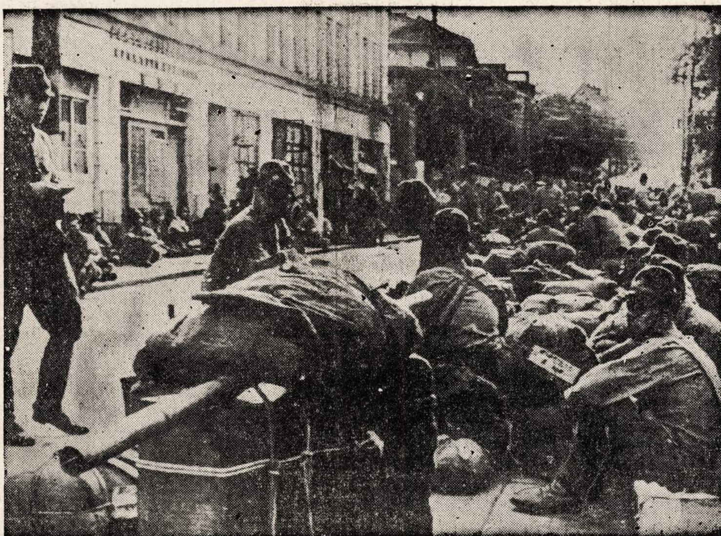
Japonų kariai laukia demobilizacijos Tokijo gatvėse. Karininkas (po kairei) duoda įsakymą grįžti namo.