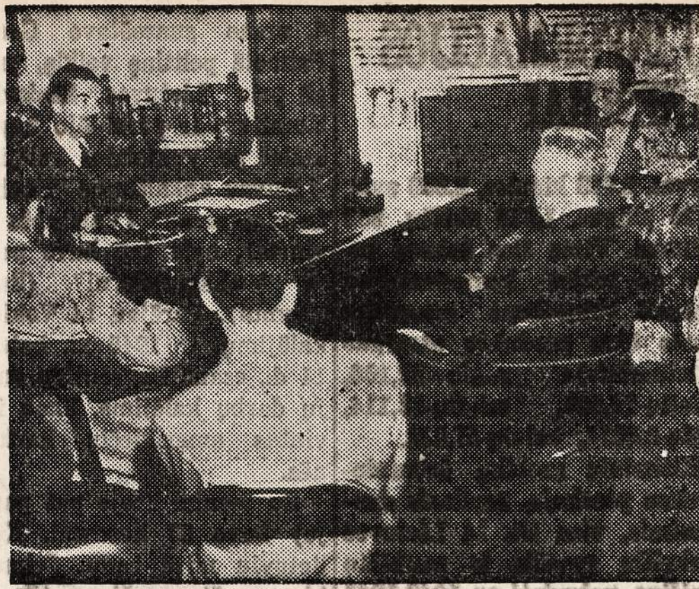
Gub. Thomas E. Dewey savo ofise Albany, N. Y., laiko konferenciją su spaudos atstovais. Jis pareiškė, kad prezidento rinkimų kampanijos metu jis žinojės faktus apie Pearl Harbor užpuolimą, tačiau, generolo George C. Marshall prašomas, jų neskelbės.

Šitas VLIK'as tai kaip tik daugiausia ir sugadino nacių ir Kubiliūno pastangas sumobilizuoti Lietuvos vyrus į vokiečių kariuomenę ir privalomiems darbam Vokietijoje. Jisai tęsė savo darbą ir pačioje Vokietijoje, kada minios žmonių iš Lietuvos leidosi vakarų link, bėgdamos nuo bolševikų ir tikėdamosi pasiekti tas sritis, į kurias artinosi amerikona ir anglai. Tie pabėgėliai numanė, kad Vokietija netrukus žlugs; todėl yra melas ir didžiausia kvailystė sakyti, kad jie keliavo į Vokietiją su tikslu padėti Hitleriui. Jie tenai bėgė, norėdami patekti demokra-