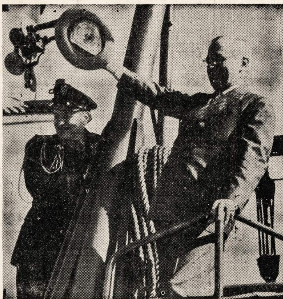
Prezidentas Trumanas su savo artimais politiškais bendradarbiais išplaukia į Chesapeake Bay.